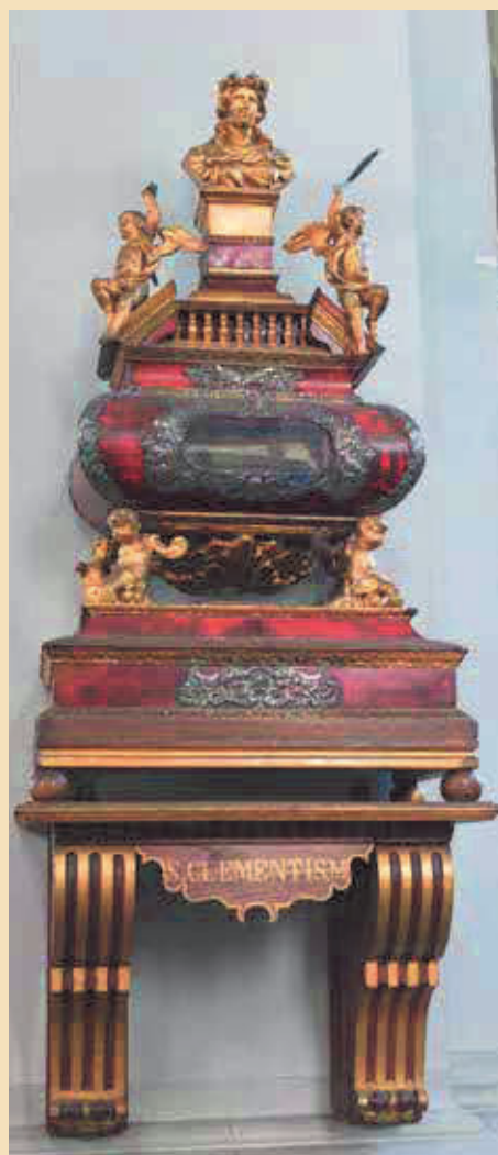
Reliekhouders aan een kolom aan de noordzijde met als opschrift S. Clementis M(artyris), maar in de cassette staat op het briefje bij een stuk gebeente met daarop twee rode waszegels: S. Valentini Mart.