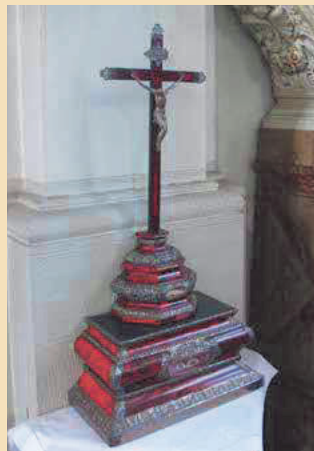
De vijfde reliekhouders is verplaatsbaar. In de voet bevinden zich drie relieken.

In het museumdepot tenslotte bevinden zich nog een twintigtal andere relieken. Een deel daarvan is relatief recent en dateert uit de 19de of de 20ste eeuw.