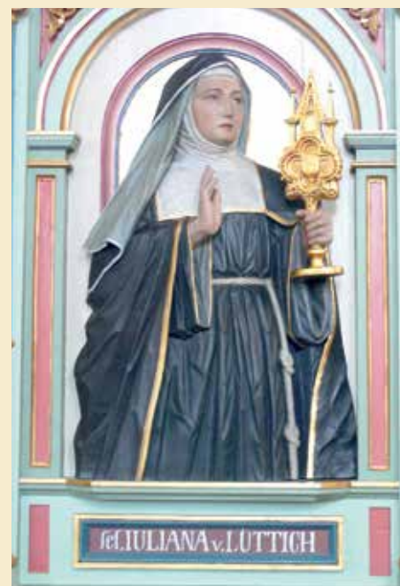
Juliana van Cornillon (1192-1258), die in Luik leefde, had een zeer grote verering voor het H. Sacrament (zie ook Begijnhofkrant 44, zomer 2014).

Juliana van Cornillon (1192-1258), die in Luik leefde, had een zeer grote verering voor het H. Sacrament en lag uiteindelijk aan de basis van de instelling van het feest van het H. Sacrament door paus Urbanus IV (1264).