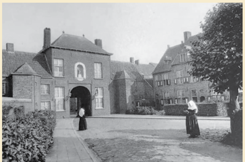
Pas vanaf de dertiende eeuw kunnen we echt spreken van het samenwonen van begijnen in begijnhoven, die een stadje in de stad of net daarbuiten vormden.

Tweede fase: Deze vrouwen beginnen samen te wonen in grotere groepen in huizen in de stad en ze worden vanaf nu “ beghinae disciplinatae ” genoemd. Ze doen blijkbaar goed werk in de ogen van de pausen, want Gregorius IX (1233) en Innocentius IV (1247) verlenen hen beschermingsbullen. Deze vorm van samenwonende begijnen noemen we nog geen echt begijnhof, maar is eerder te omschrijven als “conventen”. Ze hadden soms een “meesteres”, die hen spirituele leiding gaf, maar soms ook een parochiepriester of monnik van een reguliere orde als geestelijke leider. Meestal hadden ze geen eigen kapel, maar namen ze deel aan de erediensten in de plaatselijke parochiekerk. Ze werkten om hun eigen inkomen te verdienen en waren dus volkomen onafhankelijk van anderen. Soms was er een klein gasthuis of hospitaal in de buurt waar ze werkten. En soms stond er een kleine kapel in de buurt die ze als gebedsruimte gebruikten.