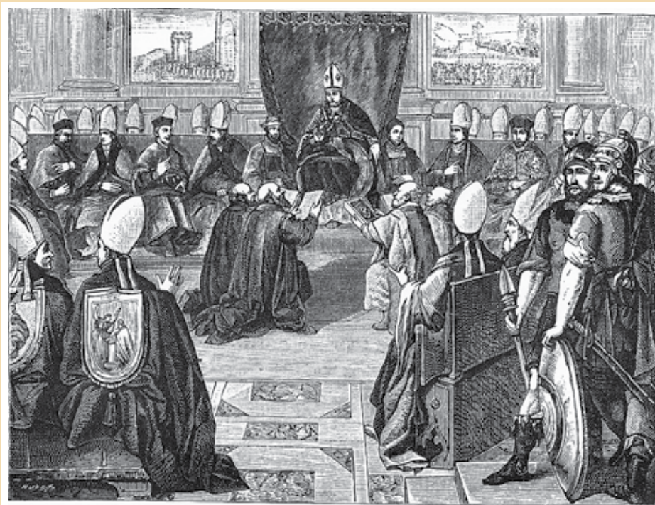
Het Concilie van Vienne vond plaats onder het pontificaat van Clemens V, die paus was van 1305 tot 1314. Twee decreten waren aan de begijnen gewijd en leidden ertoe dat vele begijnhoven werden opgeheven.

Uit het voorafgaande is duidelijk gebleken dat er gelijkenissen waren met het ontstaan van de begijnenbeweging. Dat ontstaan vond plaats in dezelfde periode. Maar geleidelijk aan nam het aantal priesters dat zich bij de minderbroeders voegde, toe. De paus verbood de lekenbroeders om het geloof te verkondigen en te prediken (weer