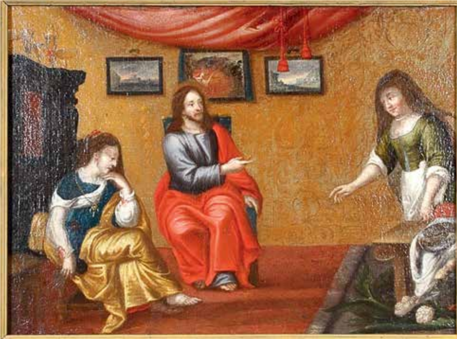
Het schilderij Jezus op bezoek bij Martha en Maria, te zien in het Begijnhofmuseum, wijst op de fundamentele keuze waarvoor de begijnen zich geplaatst wisten: leven in of naast de maatschappij. Foto: Ludo Verhoeven

profetie; als ze lacht, is het goed gezelschap; als ze huilt, is het uit devotie; als ze slaapt, is ze in vervoering; als ze droomt, heeft ze een visioen; en als ze liegt, vergeet het. Als een begijn trouwt, is dat haar roeping, maar haar eed of kloostergelofte zijn niet voor het leven. Vorig jaar huilde ze, nu bidt ze, volgend jaar neemt ze een echtgenoot. Nu is ze Martha, dan is ze Maria, nu is ze kuis, dan krijgt ze een echtgenoot." Kortom, sommige begijnen waren niet te vertrouwen en hielden er een zeer wispelturige levenswijze op na. Men kon dus de keuzes niet aanvaarden die de begijnen maakten: hun geloften waren niet voor eeuwig en ze maakten geen echte keuze tussen een contemplatief en een actief leven. Maar ook hun mystieke ervaringen werden niet geapprecieerd. Ze waren personen met twee gezichten en derhalve onbetrouwbaar.