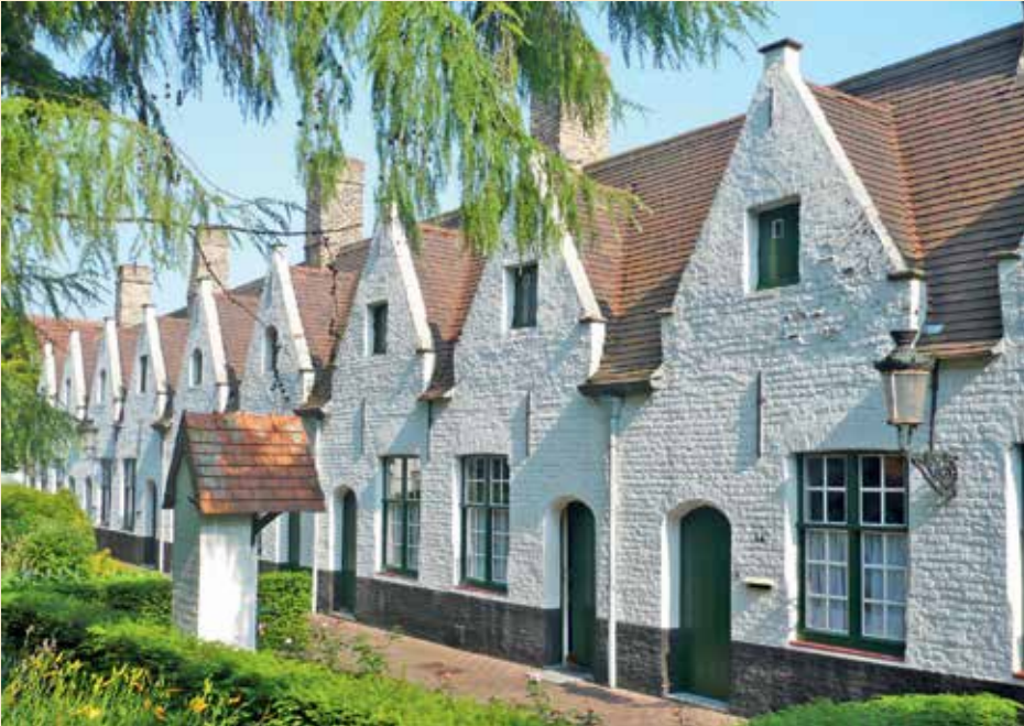
Godshuizen mogen niet worden verward met begijnhoven. Ze werden vaak opgericht ten behoeve van arme en alleenstaande oudere vrouwen in de stad, zoals hier de groep godshuizen De Muelenaere aan de Nieuwe Gentweg in Brugge, zo genoemd naar de schenker. Ze werden in 1974 bij koninklijk besluit als monument beschermd.

Dikwijls wordt de Saint-Christophekapel in Luik genoemd als het oudste voorbeeld van een kapel (ze stond er al in 1199), waar reeds in 1207-1220 begijnen samenkwamen. In Tongeren vestigden zich enkele begijnen nabij het Sint-Jacobsgasthuis (kort na 1216). Maar er zijn ook voorbeelden van begijnen die in de nabijheid van een kapel woonden zonder dat er ziekenzorg mee gemoeid was (bv. in Aken, de Zwitserse regio Vaud enz.). We vinden uit deze vroege periode al aantekeningen terug waarin vermeld staat dat de begijnen ook schenkingen kregen van de lagere adel, zodat het voortbestaan van deze prille begijnengemeenschappen gegarandeerd was.