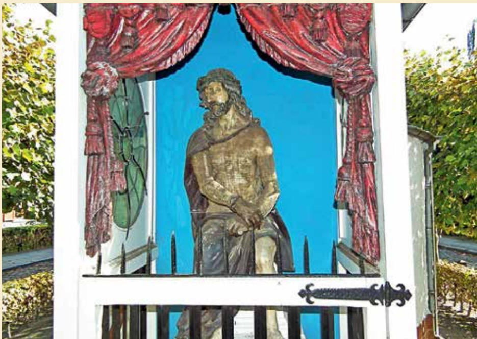
Christus op de koude steen, een van de vele afbeeldingen van het lijden van Christus op het begijnhof, dat voor menige begijn tot voorbeeld strekte.

Onder de begijnen uit die eerste periode waren er velen met interesse voor de mystiek. Hun geloof had een zinnelijk, zelfs sensueel karakter, wat bijvoorbeeld bleek uit hun voorkeur of liefde voor de bruidsmystiek, en oogstte veel succes. De mystiek is een geloof of betrachtting die de innige vereniging met de ziel van het "Opperwezen" beoogt. Dat streven beleven de mystici via meditatie en dikwijls tot in de extase toe. Zo komen ze