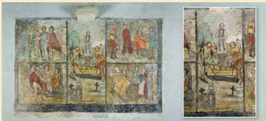
Twee afbeeldingen uit de Begijnhofkerk van Sint-Truiden (begin 16de eeuw), met links een deel van de “Zeven werken van barmhartigheid” en rechts het middenpaneel, waarin de doden worden begraven. Onderaan zie je een begijn bidden bij een graf.

Als reactie op de decadente toestanden in de kerk ontstaan in de 12de-13de eeuw bewegingen van gelovigen die willen terugkeren naar de oorspronkelijke geest van armoede en evangelische zuiverheid van de eerste kerkgemeenschappen. Deze protestbewegingen vinden veel aanhangers onder de vrouwen, omdat ze ook protesteren tegen de geringschattende houding tegenover de vrouw. Men wil in rechtstreekse relatie staan tot God zonder een omweg te moeten maken langs de corrupte bedienaars van het instituut kerk. Er heerste in die tijd een soort “religieuze geestdrift” in de Nederlanden, de Duitse gebieden, Frankrijk en Italië. Er ontstonden veel nieuwe kloosterorden, totdat de paus ze een halt toeriep, en daardoor ontstonden veel types van “religieuze bewegingen”. De basisgedachte was: de kerk zuiveren van de wantoestanden die het gevogel waren van