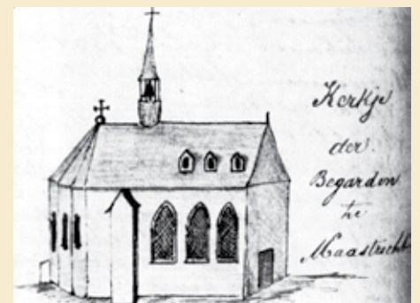
Hier en daar, zoals in Maastricht, zijn nog documenten terug te vinden die wijzen op de aanwezigheid van begarden, de mannelijke tegenhangers van de begijnen. Ze hebben uiteindelijk slechts enkele eeuwen bestaan.

Er zijn veel elementen die de opkomst van de begijnenbeweging verklaren, maar wellicht is het een wisselwerking van verschillende factoren die het klimaat voor het ontstaan van de begijnenbeweging heeft mogelijk gemaakt. Dikwijls is er beweerd dat een "vrouwenoverschot" de reden was dat begijnengemeenschappen ontstonden en dat dit te wijten was aan de kruistochten (1096-1291), waarin vele mannen gesneuveld zijn. Dat is echter iets te eenvoudig geredeneerd. Men vergeet daarbij dat samen met de hogere en lagere adel ook heel wat gewone mensen meetrokken op kruistocht, onder wie veel vrouwen, en weinigen van hen kwamen nadien terug thuis. En waarom zouden er dan ook "begarden" (mannelijke begijnen) opgedoken zijn in diezelfde periode? Nu nog zijn er in sommige steden Begardenstraten, onder meer in Antwerpen, Mechelen, Roosdaal, Tienen, Diest, Luik, Maastricht en Merchtem. Deze straatnamen wijzen op de aanwezigheid in het verleden van begarden in die omgeving. Ze duiken in dezelfde periode op als de begijnen, maar hebben nooit de bloei gekend van hun vrouwelijke tegenhangers en kregen nog veel meer dan zij de stempel van "kettters" opgeplakt.