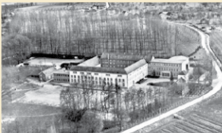
Luchtopname van het voormalige klooster van de begarden in Zepperen (Sint-Truiden), gesticht omstreeks 1425 en in 1797 onder het Franse bewind verkocht.

De opkomst van de begijnenbeweging is echter heel wat ingewikkelder om te verklaren. Aan de basis ervan ligt een verandering in de economische, culturele en godsdienstige waarden in die tijd. Het was de veranderde sociale, demografische en religieuze voedingsbodem die het ontstaan