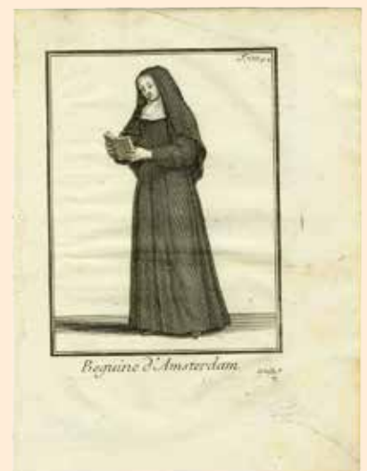
Begijnen verschillen wezenlijk van andere kloosterzusters door de geloften die zij afleggen, maar beide groepen wijden hun leven grotendeels aan bezinning en gebed. Op deze afbeelding zien we een begijn van het begijnhof van Amsterdam op een oude prent van R.P. Helyot uit 1792.

Verder kiezen zowel kloosterzusters als begijnen resoluut voor een leven volgens de leer van de rooms-katholieke kerk, gestoeld op de roomse bijbelverklaringen. Wanneer een van deze aspecten niet aanwezig is in de leefwijze van een “vrome vrouw”, is zij geen begijn of kloosterzuster meer. Het is van groot belang om de definitie van wat een begijn juist is, heel zuiver te houden. Want er zijn in de loop van de geschiedenis vele mengvormen ontstaan tussen begijnen, kloosterzusters, reclusen en andere types van religieuze vrouwen. Als we die zonder meer allemaal begijnen