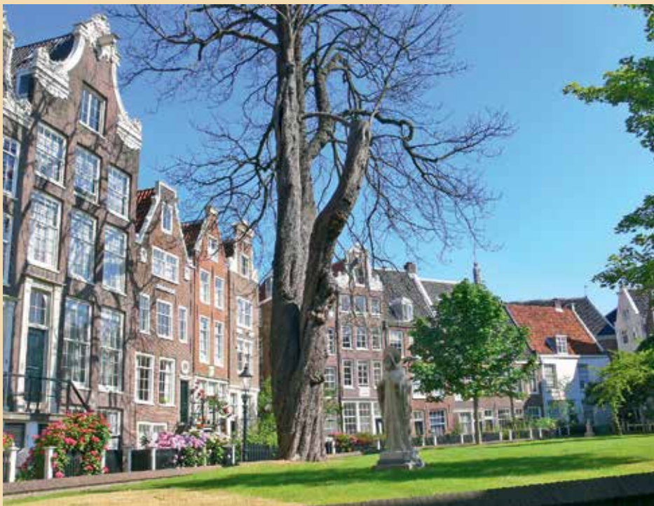
Het begijnhof van Amsterdam is een van de weinige die in Nederland nog zijn blijven bestaan.