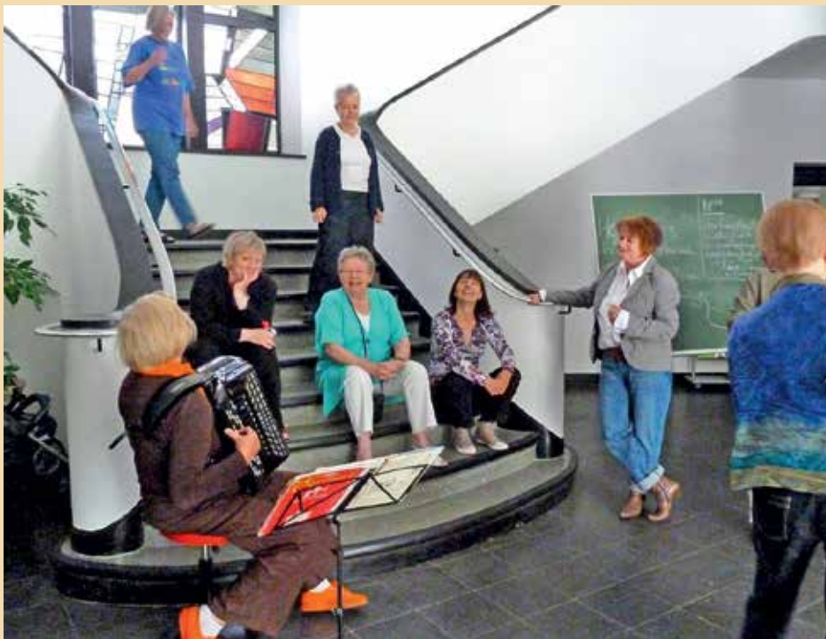
In Duitsland, zoals hier in Essen, zijn momenteel op een 15-tal plaatsen vrouwengemeenschappen actief, die zich soms begijnhoven noemen en in totaal een 500-tal leden tellen.

begijnengemeenschappen gevonden zouden zijn, maar veel concrete gegevens daarover hebben we niet.