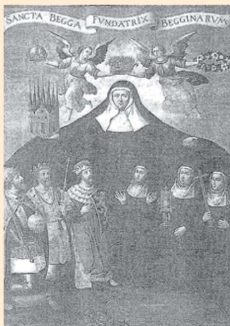
De H. Begga was de schutpatrones van Brabant in de eerste helft van de 17de eeuw, maar wordt hier voorgesteld als stichteres van de begijnen, wat blijkt uit haar kledij en het Latijnse opschrift. Het schilderij is afkomstig uit het Groot Begijnhof in Leuven, olieverf op doek, Stedelijk Museum Leuven.

Blijft de vraag: waarom traden deze vrouwen niet toe tot een bestaande kloosterorde? Wellicht zijn daar meerdere redenen voor te vinden: ze wilden zelfstandig blijven, zich niet levenslang binden aan een bepaalde levenswijze, kregen geen toegang tot een kloosterorde, omdat er in die periode zo’n wildgroei was en er geen nieuwe kloosterordes meer opgericht mochten worden, of gewoon omdat er geen plaats meer was voor nieuwe vrouwelijke religieuzen... De begijnen werden aanvankelijk wel gedoogd door paus Honorius II (1216).