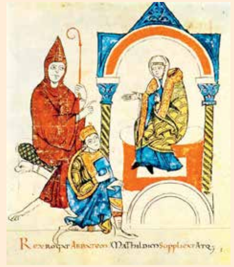
Hoogtepunt van de Investituurstrijd: keizer Hendrik IV vraagt Mathilde van Toscane en abt Hugo van Cluny om te bemiddelen om de excommunicatie van die eerste te beëindigen. Miniatuur uit het manuscript Vita Mathildis (ca. 1115), bewaard in de Vaticaanse Bibliotheek.

Het duurde tot aan het Tweede Concilie van Lateranen (1139) vooraleer men definitief de celibaatsverplichting aan priesters oplegde. Het was een verplichting die maar langzaam aanvaard werd door de lokale priesters in de dorpen. Paus Gregorius (van de Gregoriaanse Hervorming, 1073-1085) probeerde het celibaat al eerder op te leggen en streefde er ook naar de praktijk van “simonie” (de verhandeling van kerkelijke ambten) uit te roeien. Er brak een continue strijd uit tussen de paus en de wereldlijke leiders omtrent het recht om bisschoppen en abten te benoemen, een periode die bekend staat onder de naam “investituurstrijd” (1075-1152). Het was de tijd waarin in Cluny (Frankrijk) een machtig benedictijnerklooster bloeide. Gesteund door het klooster van Cluny, begon de paus zijn strijd tegen de simonie en het omzeilen