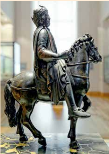
Ruiterstandbeeld van Karel de Grote in het Louvre in Parijs, zeer waarschijnlijk een vrij waarheidsgetrouwe weergave van deze heerser.

Het is wellicht door die totale zelfstandigheid van gemaakte keuzes dat velen nogal argwanend stonden tegenover de begijnen, omdat zij daarmee afweken van het “vertrouwde wereldbeeld”.