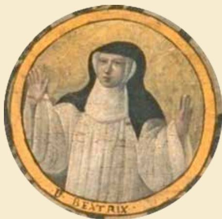
Beatrijs van Nazareth, die korte tijd begijn zou zijn geweest, schuwde in haar traktaten de straffe uitspraken niet.

Hoeveel begijnen er in die tijd waren, is moeilijk met zekerheid te zeggen. Er duiken veel uiteenlopende cijfers op in de geschiedschrijving. In Nijvel zouden er tussen 1256 en 1263 circa 2000 zijn geweest en in Keulen in de eerste helft van de 13de eeuw een gelijkaardig aantal. Wellicht zijn deze aantallen overdreven.