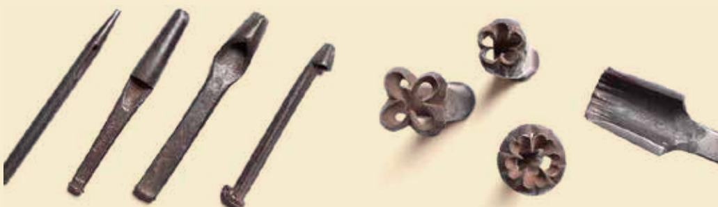
Enkele motiefijzers voor het maken van kunstbloemen, een van de geliefde bezigheden van de begijnen.