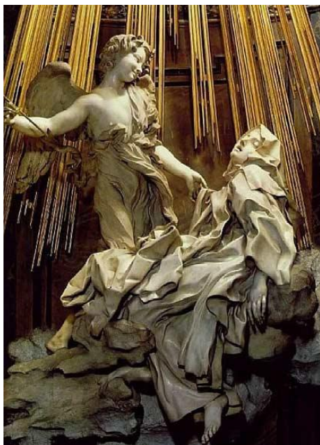
De beroemdste voorstelling van de Transverberatio Cordis (doorboring van het hart) is Bernini's marmeren groep in de Santa Maria della Vittoria te Rome (1647-1652).

De beroemdste voorstelling van deze Transverberatio Cordis (doorboring van het hart) is Bernini's marmeren groep in de Santa Maria della Vittoria te Rome (1647-1652). Het beeld speelt een rol in Het Bernini Mysterie , een boek uit de bekende thrillerreeks van Dan Brown uit 2004. Ook het bas-reliëf in de Kapel van het H. Aanschijn toont haar mystieke visioen met de doorboring van haar hart door een pijl van liefde. Achter de geknielde karmelietes komt een engel met een speer aangevlogen. Zijn lange haren en kleding wapperen in de lucht. De speer is op de heilige gericht. Zij heeft haar boek uit haar handen laten vallen en strekt de armen in een wijds gebaar van ontvankelijkheid om te komen tot de liefdesvereniging met Christus en de Allerheiligste Drie-eenheid 9 . Bovenaan rechts verschijnt het alziende oog in een gelijkzijdige driehoek als Triniteitssymbool.