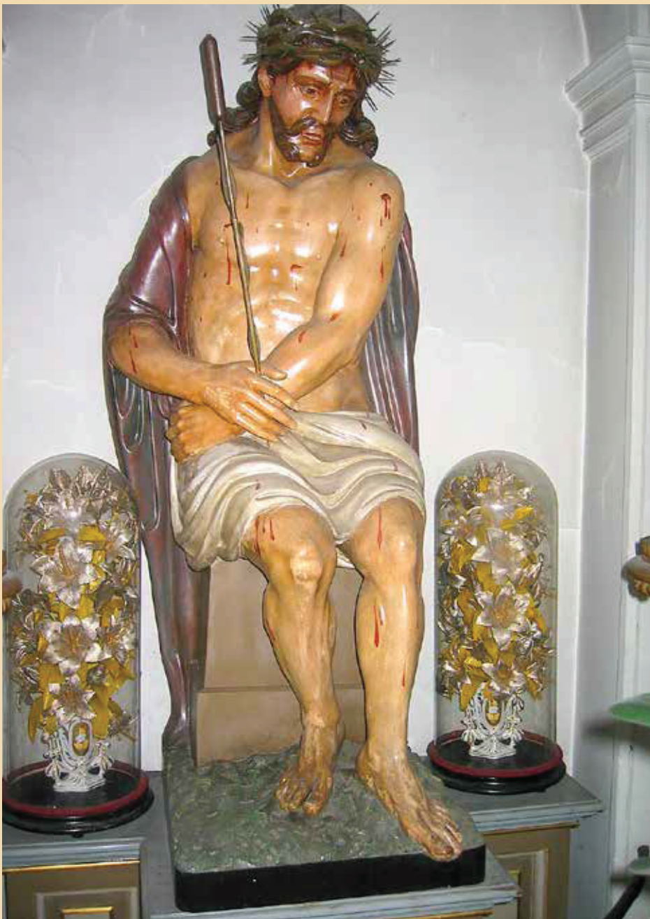
Het houten beeld in de Begijnhofkerk van Turnhout: bemerk de paarse mantel, die verwijst naar het oorspronkelijke beeld uit de 17de eeuw dat door een brand volledig verloren ging in 1971. Het verbrande beeld werd in 1972 vervangen door dit nieuwe beeld van André Proost.

De brand van 1686 was ontstaan in een huis nabij de oranjemolen, op het einde van de Otterstraat. Een hevige wind bracht het vuur over naar de nabijgelegen huizen, die bijna allemaal met stro gedekt waren