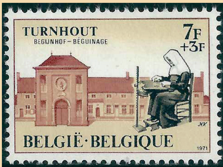
De filantropische uitgifte van de postzegel uit 1971 met een afbeelding van het begijnhof van Turnhout.