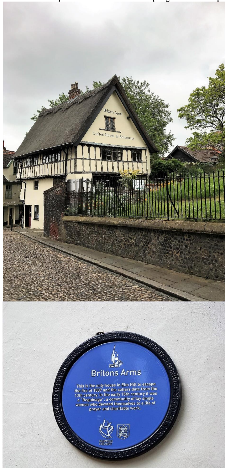
Afb. 4-5: Britons Arms is het enige huis op Elm Hill dat in 1507 ontsnapte aan een brand. De kelders dateren uit de 13de eeuw. Volgens de 'blue plaque' 16 aan de zijkant van het huis was het in het begin van de 15de eeuw een 'beguinage'. Nu zouden we het een 'convent' of 'convent beguinage' 16 noemen.

Het was zeker ook zeer geschikt om een aantal van bovenvermelde dames te huisvesten. Er waren twee verwarmde kamers op elk van de drie verdiepingen en ook op de vliering. 13, 33