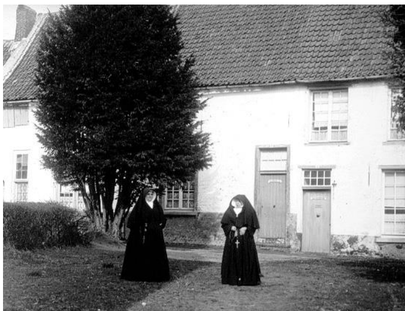
In de bloeiperiode, op het einde van de 17de eeuw, woonden er niet minder dan 160 begijnen.