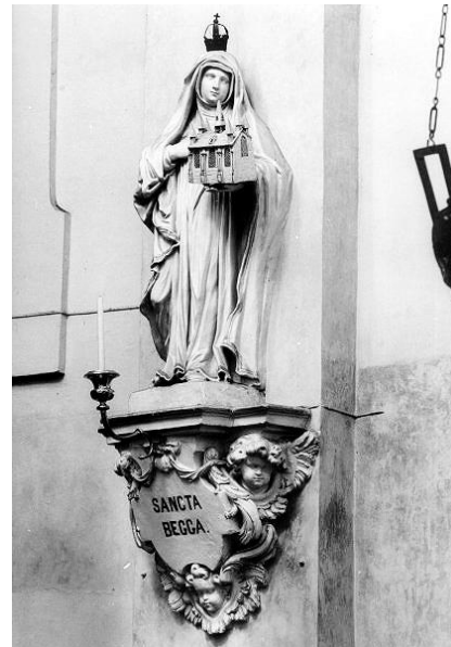
De Heilige Begga in de begijnhofkerk