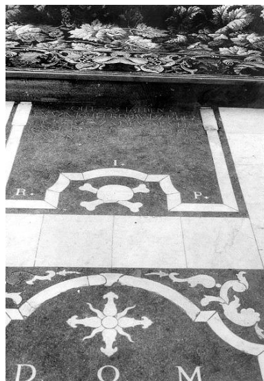
Enkele grafstenen in de begijnhofkerk