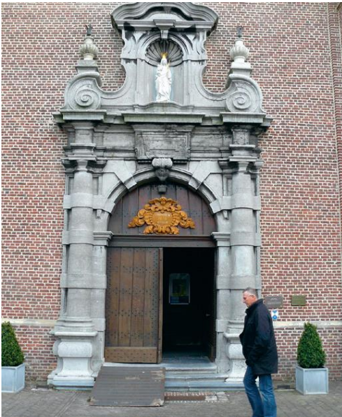
De toegang is rijkelijk versierd met een portaal uit arduin. Boven de deur, in een nis met schelpmotieven, prijkt het beeld van Maria.