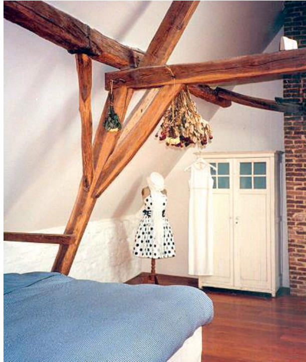
De zachte restauratie gebeurde met een maximaal behoud van waardevolle elementen, geheel in de geest van het Charter van Venetië.