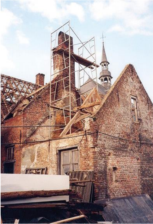
De restauratie van een begijnhofhuis