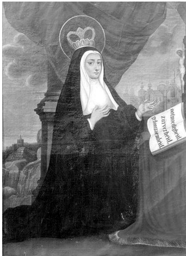
De heilige Begga – schilderij in de begijnhofkerk