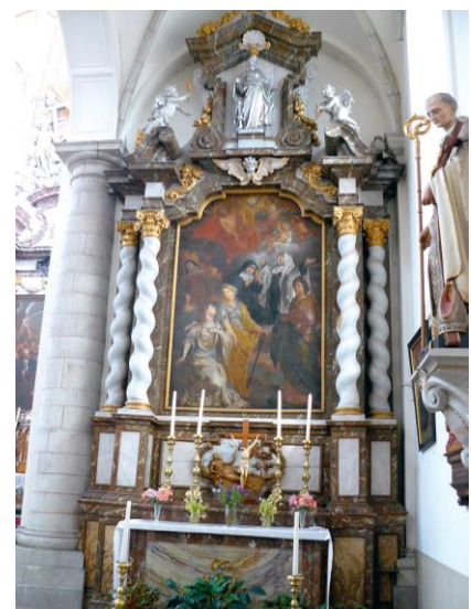
Het altaar in de zuidzijbeuk is opgedragen aan de Heilige Katharina en andere heilige maagden. Het schilderij werd gemaakt door L.Maes rond 1685 en verbeeldt de Heilige Drievuldigheid bovenaan en een aantal heilige maagden onderaan