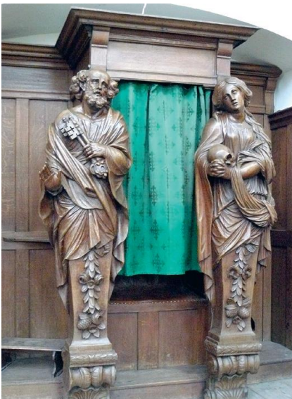
De sobere biechtstoel aan de zuidkant met Sint-Pieter (links) en de H. Maria Magdalena.