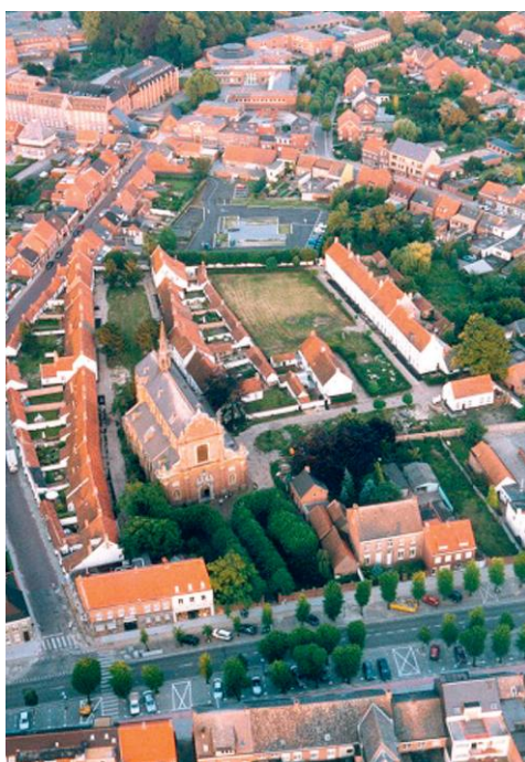
Luchtfoto van het begijnhof van Hoogstraten

Dat was ooit anders. Jarenlang werd het begijnhof van Hoogstraten immers aan zijn lot overgelaten. Maar in het begin van de jaren '90 kwam het opnieuw in de belangstelling en ontstonden er plannen om het geheel te renoveren. Bij de lokale bevolking leefde immers de vrees dat het begijnhof in handen zou komen van projectontwikkelaars, die onvoldoende oog zouden hebben voor de cultuurhistorische waarde en sociale dimensie ervan. De vzw Convent zorgde ervoor dat dit niet gebeurde en dat het begijnhof in zijn volle glorie kon worden hersteld. Dit renovatieproject, dat vijf jaar duurde, werd meermaals bekroond. Vandaag ligt het begijnhof er weer heel fraai bij als een oase van rust in het voor de rest behoorlijk drukke Hoogstraten.