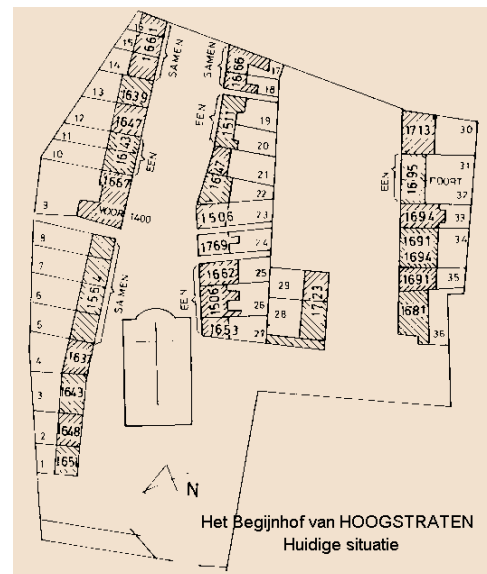
Het begijnhof van Hoogstraten in zijn huidige toestand: de oorspronkelijke jaartallen zijn in ieder huis vermeld.

De ingang van het hof situeerde zich langs de 's Boschstraat. De linkerzijgevel van het latere Conventshuis (nu nr. 9) was oorspronkelijk de voorgevel van een kleine woning die naast de toegangsweg stond. In de begijnhofmuur, achter nr. 9, zijn de sporen van de eerste poort nog zichtbaar. Ten noorden van de toegangsweg stonden nog vier huizen, de huidige woningen met de nummers 5, 6, 7 en 8, die gebouwd werden na de brand in 1563. In die dagen stond de begijnhofmuur naast woning nr. 5, evenwijdig aan de Vrijheid, langs de Achterstraat, de verbinding tussen de Peperstraat en de Leemstraat, twee straten die nu nog bestaan. Langs deze muur stond, ter hoogte van het koor van de huidige kerk, de eerste kapel van het begijnhof.