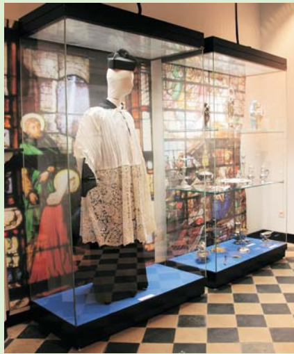
Koning Boudewijnstichting, aan het Begijnhofmuseum geschonken 19 .