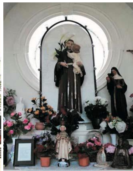
Sint-Antonius van Padua wordt in de kapel vereerd.