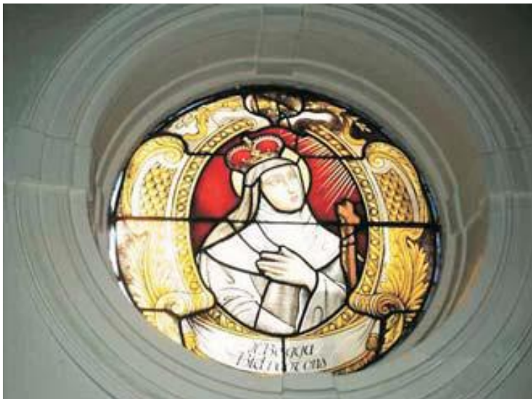
Glasraam van de Heilige Begga in de zijwand van de kapel.

Het kleine vierkante gebouwtje van baksteen met natuurstenen afwerking is afgedekt met een achtkantige koepel met lantaarn. De rondboogvormige deur met glas in lood wordt beschermd door hekwerk in gesmeed ijzer; de vier hoeken van de kapel zijn bekroond met engelenfiguren. In de kleine ronde glasramen vinden we afbeeldingen van de H. Begga en van Joanna Dedemaeker (beschadigd door vandalisme).