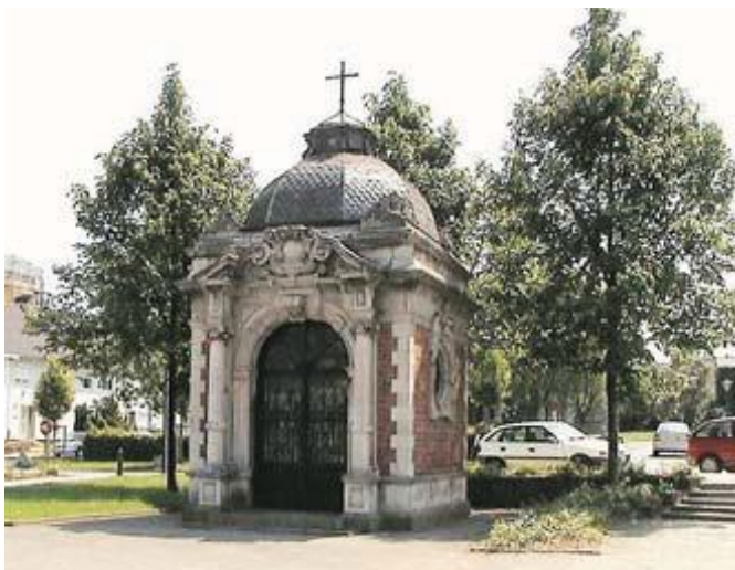
De St.-Antonius van Paduakapel

De classicistische stijl met tamelijk imposante toren straalt een koele monumentaliteit uit, die niet helemaal past in dit kader. Wel interessant is dat het hier gaat om een constructie die dateert uit een periode waarin de godsdienstige bouwbedrijvigheid helemaal stil lag.