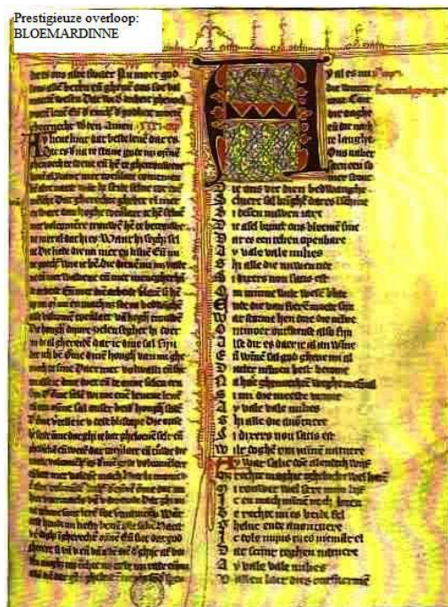
Hadewijchs eerste Strofisch Gedicht: “Ay al es nu die winter cout / cort die daghe / ende die nachte langhe”, Handschrift Gent, UB, 941, f. 49 r, einde 14de eeuw.