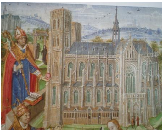
De collegiale kerk Sint-Goedele: detail van een miniatuur uit het getijdenboek van Margaretha van York, circa 1468, Koninklijke Bibliotheek Albert I, Brussel, Hs. 9296.