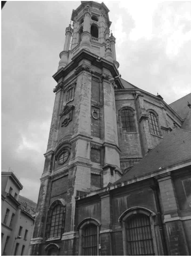
Sint-Jan-de-Doperkerk, nog steeds één van de mooiste Vlaamse barokgebouwen.