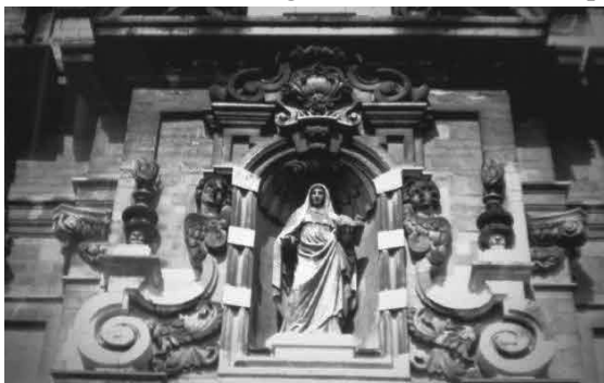
Beeld van de Heilige Begga (H. Sterckx, 1856) in de nis van de monumentale westgevel van de Brusselse begijnhofkerk. De overvloedige sculpturale ornamenten zijn kenmerken voor de vol plastische Italiaans-Vlaamse barok. 9

Ook in de 18de-eeuwse lofdichten wordt Begga als moeder vermeld. 16 Dit is onder andere het geval in het lofdicht dat in 1767 werd geschreven ter gelegenheid van de professie van Catharina Van den Velden... “als sy solmnelyck aen Jesus sigh verbind onder den regel van de H. moeder Begga”. Bij de professie van Maria De Coninck klinkt het in 1769 als volgt: “doende haere solemnele beloftens onder de regel van de H. moeder Begga”. Beelden en schilderijen van deze heilige zijn nu te vinden op alle begijnhoven, onder meer in de nis van de monumentale westgevel van de St.-Jan-Baptistkerk.