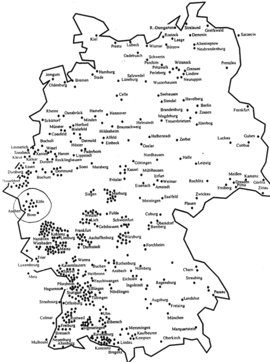
Kaart van Duitsland. Begijnen kwamen in heel Duitsland voor, zoals deze kaart illustreert. Alleen in Aken en Wesel bestonden begijnhoven waarvan het uitzicht overeenstemde met die in de Nederlanden. Elders kwamen enkel conventen voor.

Het grote verschil in waarneming van de begijnenbeweging in Vlaanderen en Duitsland ligt in het feit dat wij volop over zichtbare getuigen – in casu de architectuur van de begijnhoven en hun rijkdom aan kunstschaten – beschikken, terwijl andere landen het met vage sporen en archiefstukken moeten stellen. Duitsland kende wel degelijk een bloeiende begijnenbeweging.