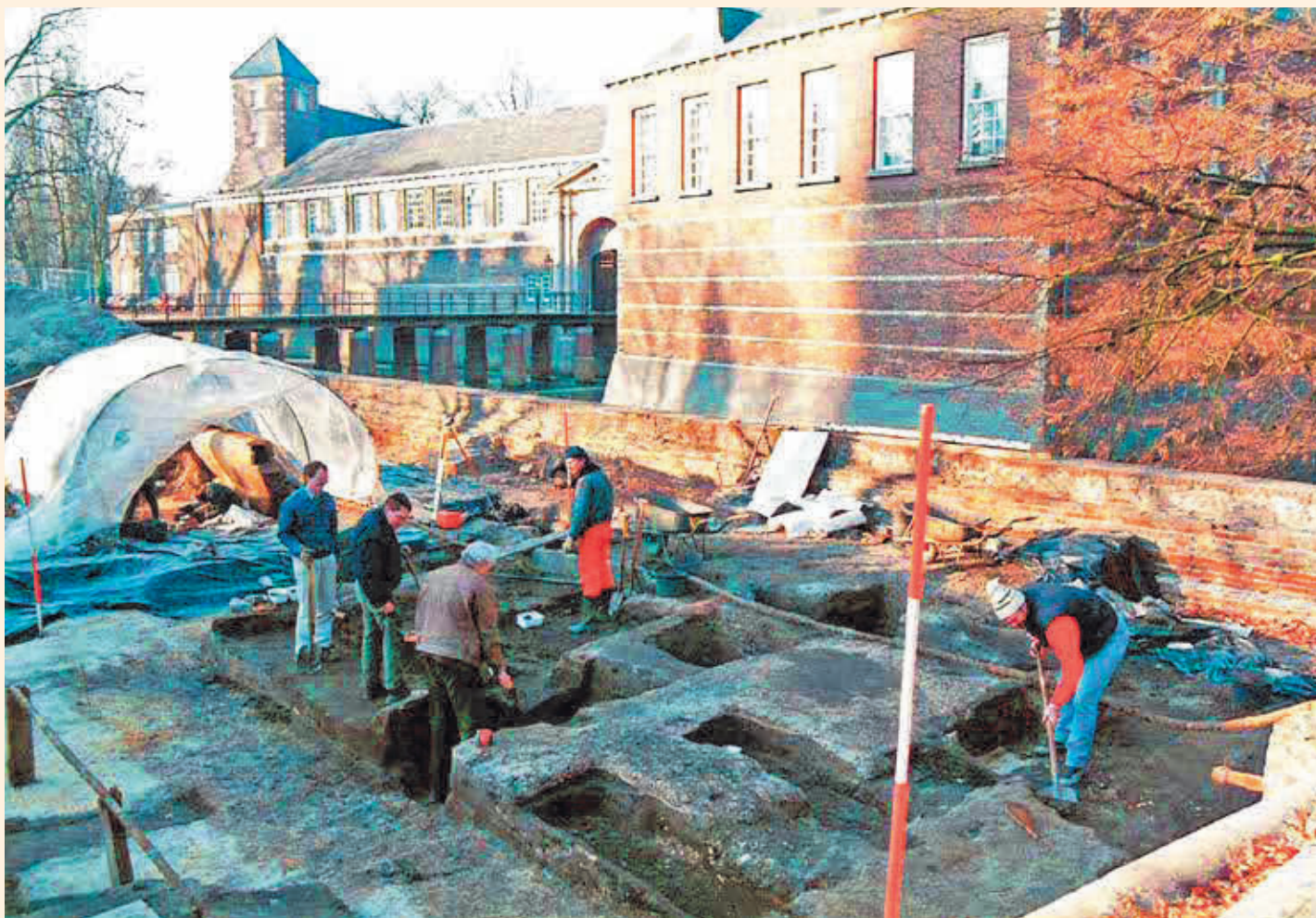
In de periode 1994-1996 werden door de archeologische dienst van de gemeente Breda opgravingen uitgevoerd op het middeleeuwse beghijnhof aan de Valkenberg, grenzend aan het Kasteelplein.