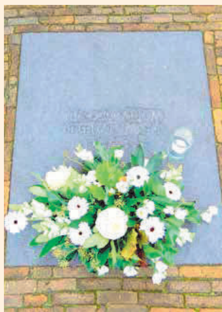
Verzamelgraf van de restanten van de beghijnen aan de buitenkant van de Waalse Kerk in Breda: “Hic ossuarium beginarum c.a. 1267-1534” (Dit is het verzamelgraf van beghijnen en anderen 1267-1534).

Ook op het Bredase beghijnhof gebeurde meer recent een dergelijke herbegraving. In de periode 1994-1996 werden door de archeologische dienst van de gemeente