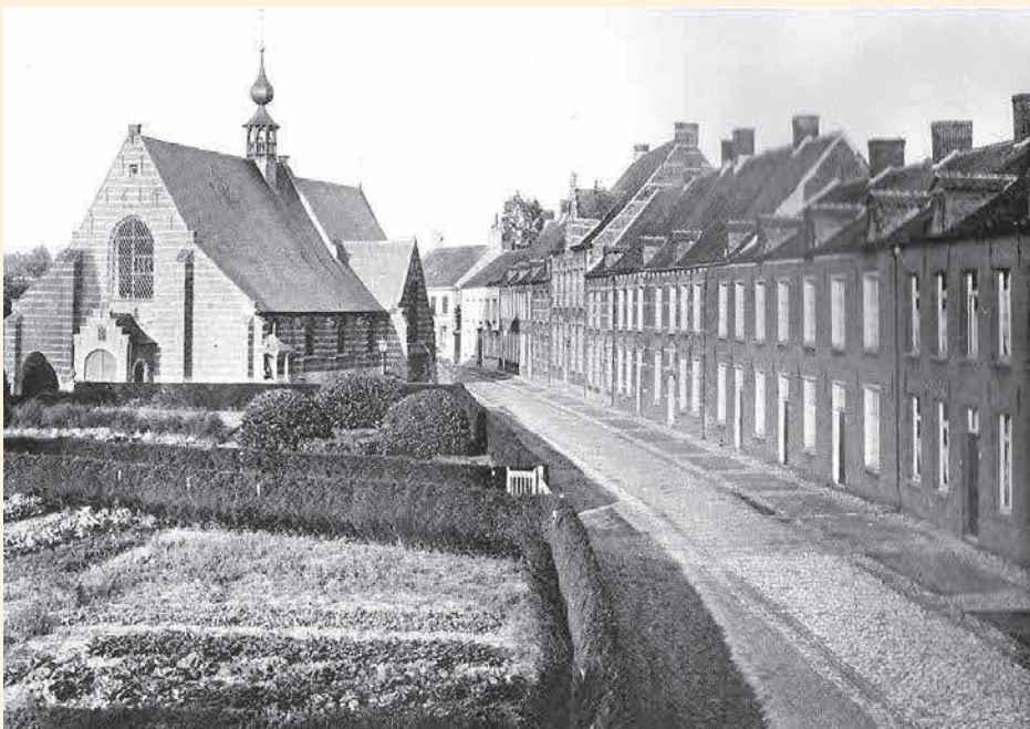
Eind 16de eeuw verkreeg men de toelating om een nieuw begijnhof met bijbehorende kerk te bouwen in Herentals, nadat het oude aan Nieuwland eerder volledig was verwoest door brand.