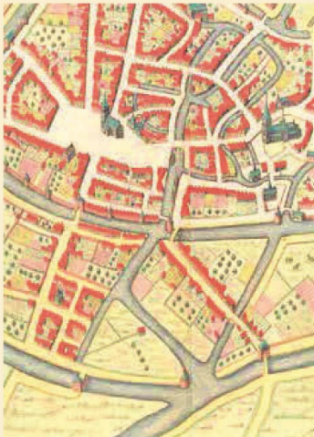
Lier in 1698 in het Stedenboek Frederik de Wit , met linksonder het begijnhof en rechtsboven de Sint Gummarskerk.

Met dat laatste woord komen we bij een weinig tot onbekend gegeven: hoe het begijnhof van Lier een bredere sociale functie vervulde. Zo bleken ook niet-begijnen, zij het alleen vrouwen, en weliswaar onder beperkende voorwaarden, welkom op het begijnhof, niet enkel als bewoonsters, maar ook, nogmaals onder voorwaarden, als ze ziek waren in de infirmerie. In een tijd waarin de sociale voorzieningen voor armen, ouderen, zieken en hulpbehoevendens uiterst schaars