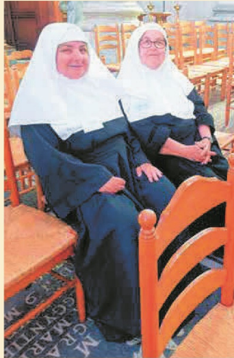
De kledingvoorschriften voor de begijnen waren bijzonder strikt en werden uitvoerig beschreven in de eerste statuten.

waren, mogen we gewagen van een aanpak van eigen aard: de toegang tot de infirmerie bleef niet beperkt tot begijnen alleen, waarover verder meer.