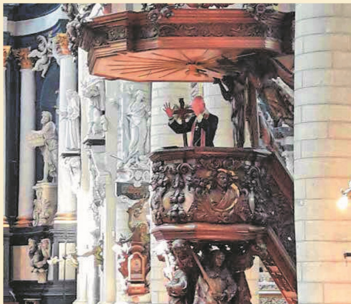
De godsdienstregels voor de begijnen waren bijzonder streng en de pastoor herinnerde hen geregeld aan hun plichten vanop de preekstoel.

Een verklaring daarvoor is goed honderd jaar eerder deels te vinden in de aflatbrief (3) die anno 1300 werd gegeven om de infirmerie of het hospitaal te steunen: "Cum igitur in infirmeria sive hospitali curis Lirensis Cameracensis diocesis die noctuque recipiantur infirmas mulieres debiles et egenas a quibuscumque Christianorum partibus venientes et cis prout ipsius infirmeriae facultates suppetunt sint a Magistra et sororibus ipsius infirmeriae." Of vrij vertaald: "En zo ook worden in de infirmerie of het hospitaal van het begijnhof te Lier gelegen in het bisdom van Kamerijk dag en nacht zieke, zwakke en hulpbehoevende vrouwen opgevangen, en dit van waar zij ook uit de christenwereld komen. Maar deze infirmerie dient over de