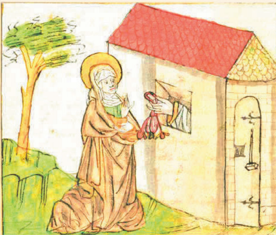
Wiborada kwam in 912 van Konstanz over het meer naar St. Gallen en woonde in een cel in de kerk van St. Georgen op de zuidelijke hoogten boven het klooster.