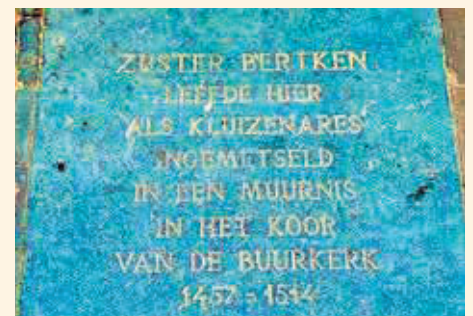
Deze gedenksteen verwijst naar het kluzenaressenbestaan van Suster Bertken in de buurkerk van Utrecht, waar ze verbleef van 1457 tot 1514.

"Dit boek beschrijft de opkomst van dit nieuwe fenomeen. Aan de hand van vijf voorbeelden van kluzenaressen over wie toevallig een min of meer uitgebreide levensbeschrijving bewaard is gebleven, allen levend in het Deltagebied tussen Seine en Elbe, probeer ik een historisch beeld te schetsen van het nieuwe kluzenaarschap. Ik probeer de stadskluzenaressen een gezicht en een verhaal te geven. Mijn vijftal leefde in de twaalfde en dertiende eeuw en het demonstreert dat toen de tijd rijp was voor dit nieuwe type van religieuze vrouw, een type dat grote aantrekkingskracht zou gaan uitoefenen... Voor die eerste twee eeuwen alleen heb ik voor de Lage Landen reeds zo'n tweehonderd namen verzameld."