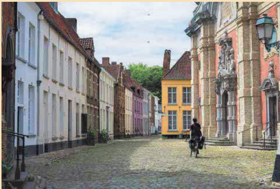
Met steun van de Vlaamse overheid wil de stad Lier de komende jaren zo'n 45 woningen en de bestrating in het Lierse begijnhof grondig renoveren.

H et ontstaan van het Lierse begijnhof rond het midden van de 13de eeuw sluit nauw aan bij de ontstaansgeschiedenis van de stad. Oorspronkelijk zou er sprake geweest zijn van een pleinbegijnhof. Op de locatie van de huidige Sint-Margarethakerk bevond zich een kapel met daarrond wat vandaag bekend staat als het Oud-Kerkhof. Ook de Sint-Margarethastraat dateert uit de eerste periode. In latere eeuwen werd het begijnhof almaar uitgebreid, waardoor een heus stratenbegijnhof ontstond. Met een uitgewerkt beheersplan, dat de stad in 2016 in overleg met het OCMW en het kerkbestuur liet opmaken en dat eind 2018 werd goedgekeurd, kwam er een toekomstvisie voor het begijnhof. Dit plan vormt de aanzet om, met steun van de Vlaamse overheid, dit werelderfgoed een nieuwe uitstraling te geven. In verschillende fasen zullen in 5 jaar tijd zo'n 45 woningen worden gerestaureerd en de bestrating aangepakt. Eind 2025 zou een en ander voltooid moeten zijn.