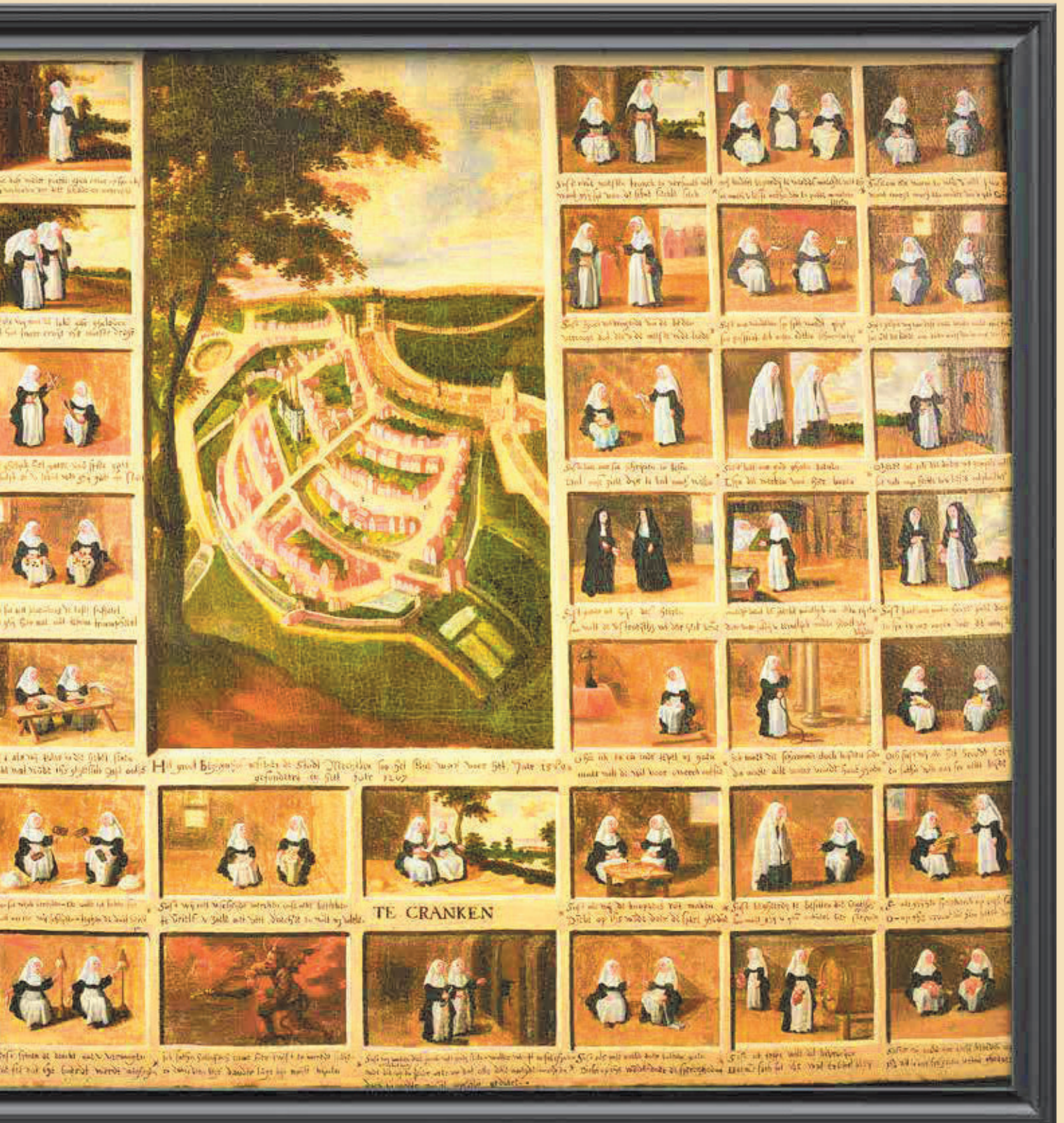
Afbeelding 1 - Foto: Museum Hof van Busleyden, Mechelen: Joris Luyten

aard van de werkzaamheden benadrukt. Bij vrijwel alle werken die de begijnen uitvoeren, wordt benadrukt dat die ter meerdere eer en glorie van God gebeuren, als een herinnering aan het spirituele beleven van het geloof, ook of juist tijdens het werk. Tenslotte waren al deze vrouwen mede vanwege die spirituele beleving begijn geworden.