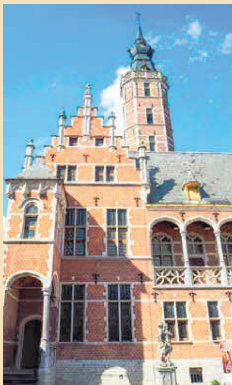
Museum Hof van Busleyden, een groots en prachtig renaissance stadspaleis in Mechelen.

Dat zelfvoorzienend zijn viel voor de meesten bij lange na niet mee, tenzij men van huis uit gefortuneerd genoeg was en min of meer kon rentenieren, terwijl men goede werken deed. Dus hoe deden die minder rijke begijnen dat dan?