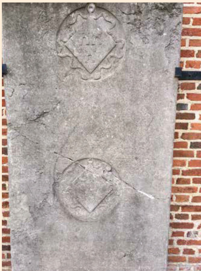
Foto 2: Deze grafplaat is van begijn Emerantiana Rijsheuvels, gestorven op 10 oktober 1717.