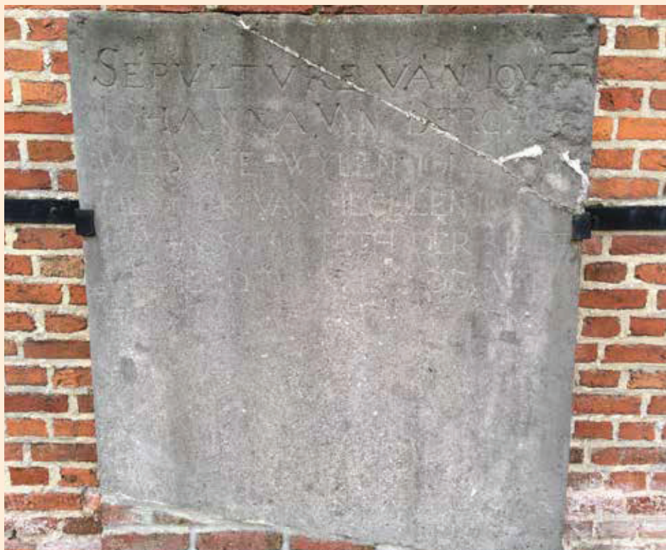
Foto 3: Grafplaat die verwijst naar Johanna van Berchem, overleden in 1611, maar helaas grotendeels onleesbaar.