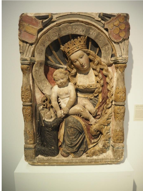
Maria met kind en schenksters. Cisterciënzerinnenklooster Dalheim 1520/30.

De cisterciënzers beoefenden niet alleen landbouw en diverse ambachten, zij waren eveneens beslagen op het vlak van de ijzerbewerking en de productie van bouwmaterialen (bakstenen, tegels). In de eerste plaats voorzagen zij in hun eigen behoeften, maar de handel won al gauw aan belang. Zo waren de cisterciënzers niet uitsluitend afhankelijk van milde schenkers. Ook in het kredietwezen werden zij actief. De witte monniken hielden eraan de afspraken en transacties met hun handelspartners schriftelijk vast te leggen. Daartoe beschikten zij over vaak hoog opgeleide conversen, die van hun religieuze verplichtingen grotendeels waren vrijgesteld. De tentoonstelling biedt inzicht in de boekhouding van de cisterciënzers met rekeningen, kaarten en contracten. In dit verband worden verscheidene stukken uit Ter Duinen getoond.