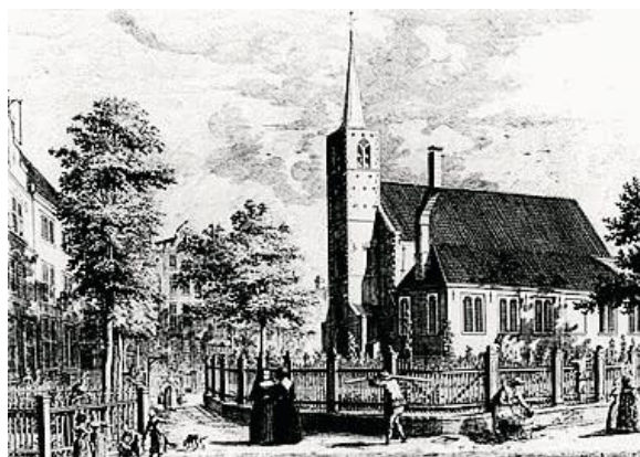
De begijnen moesten hun kerk op het hof afstaan onder druk van de protestantse hervorming. Deze kerk werd aan de Engelsen gegeven en heet sindsdien de “Engelse kerk”.

De ijver van de predikanten om ieder huis dat voor “Paepsche afgoderij” gebruikt werd, te melden bij de overheid, was groot. Maar de overheid maakte slechts in beperkte mate gebruik van geweld en strengheid. Ook de begijnen moesten hun kerk op het hof afstaan. Deze kerk werd aan de Engelsen gegeven en heet sindsdien de “Engelse kerk”. Maar de katholieken richtten “huiskerken” op om toch hun geloof te kunnen belijden. De naam “schuilkerken” ontstond pas in de 19de eeuw.