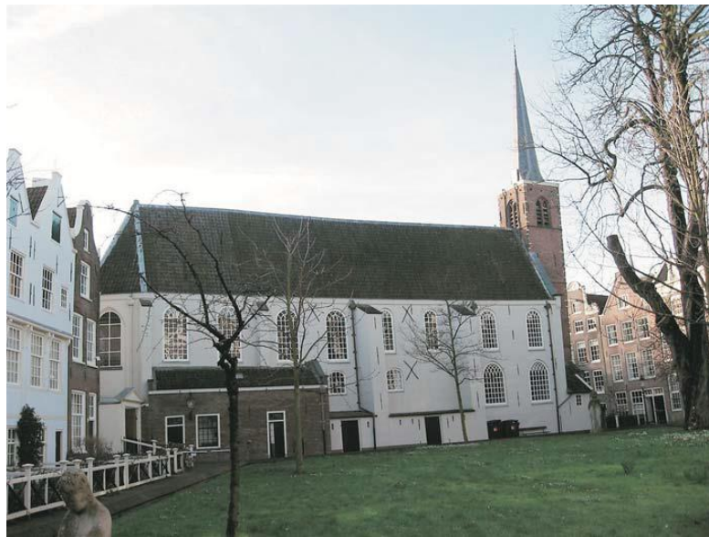
De katholieke kapel, die onder dwang van de protestantse overheden in 1607 aan de Engelse presbyterianen moest worden afgestaan, heet nu de Engelse kerk. De kerk is in 1650 vergroot met een zuidelijke zijbeuk.

Het begijnhof was de enige katholieke instelling die na de Alteratie van 1578 bleef bestaan. De overige katholieke kerken en instellingen werden, zoals gezegd, met geweld gedwongen over te gaan naar het protestantse geloof. De begijnhofhuizen waren echter particuliere eigendom van de begijntjes en konden dus niet worden onteigend. Wel moest de katholieke kapel aan de Engelse presbyterianen (hervormd protestanten) worden afgestaan, onder dwang van de protestantse overheden. Sindsdien wordt dit kerkje de Engelse kerk genoemd. Tegenover de ingang van de kapel werden in 1671 door architect Philips Vingboons twee woonhuizen omgebouwd tot een rooms-katholieke schuilkerk: de H.H. Johannes en Ursulakerk, genoemd naar de twee beschermheiligen van het begijnhof. Nadat de Kapel ter Heilige Stede in 1908 was afgebroken, werd deze kerk officieel de mirakelkerk.