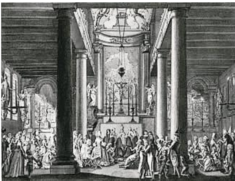
De Begijnhofkapel in 1792

Nadat de begijnen hun kerk hadden moeten afstaan, kerkten zij in de sacristie van de kerk. Nadat ook deze sacristie ontnomen werd, kerkten zij afwisselend in een van de huisjes op het hof. De eerste initiatieven voor de bouw van de huidige Begijnhofkapel werden al in 1665 genomen door samenvoeging van twee huizen, daartoe aangekocht op initiatief van pastoor Van der Mye (1665-1700). Zijn neefje legde de eerste steen op 2 juli 1671. Het stadsbestuur keurde de plannen voor de bouw goed op voorwaarde dat van buitenaf niet te zien was dat er een kerk stond. Het gebouw is ontworpen door de Amsterdamse katholieke bouwmeester Philips Vingboons (1607-1678). Deze kapel op het begijnhof werd opgedragen aan Joannes de Evangelist en Sint-Ursula. In haar huidige vorm heeft de kapel een tweedelige galerij, die op zes houten kolommen rust. De voorgevel met spitsboogvensters en glas-in-loodramen dateert pas uit de 19de eeuw. Ten tijde van de opening van de kapel in 1682 woonden er 150 begijnen en 12 weduwen en alleenstaande vrouwen op het hof.