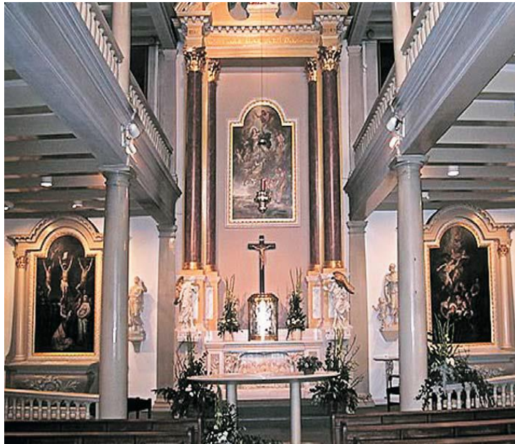
De Begijnhofkapel in haar huidige staat

Het hof heeft twee bleekvelden, waar de was te bleken werd gelegd, met de Begijnhofkapel er tussenin. Het oude, in 1907 gerestaureerde poortje aan de Begijnensloot dateert uit 1574 en heeft een steen waarop Sint-Ursula is afgebeeld, de patrones van de Amsterdamse begijnen. Het poortje aan de zijde van het Spui, van ongeveer 1725, maakte in de 19de eeuw plaats voor het poortgebouw dat er nu staat. Het begijnhof bevat een groot aantal gevelstenen, waarvan de meeste een duidelijk rooms-katholiek karakter hebben