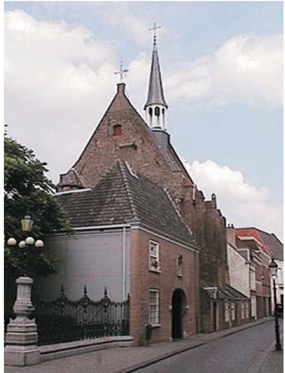
De Sint-Wendelinuskapel of Waalse Kerk is een zeldzaam exemplaar van een oorspronkelijk middeleeuwse stadskapel, die veel elementen uit de oudste tijd heeft behouden.

woonde, opende en sloot de poort. Iedere begin moest zich bij haar melden. Het Valkenberg, tegenwoordig het Valkenberg Park genoemd, werd indertijd bestempeld “als zijnde geene genoegzaam stille plaats voor Geestelijke Kinderen” en werd halverwege de 19de eeuw voor de begijnen verboden terrein verklaard.