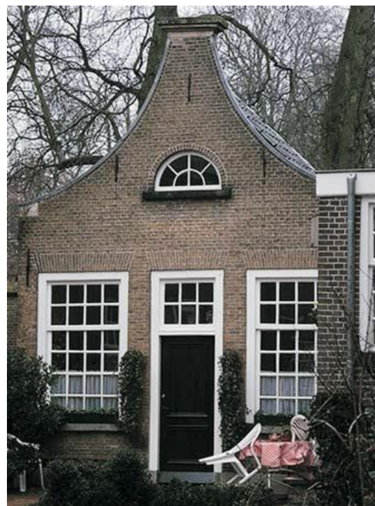
Het Kakhuis dateert van 1856.

Het Kakhuis dateert van 1856. Er waren vier "kakdozen". Het spoelwater haalden de begijnen bij de pomp. Tot in de jaren '70 zijn ze in gebruik gebleven; daarna kregen de huisjes waterleiding en toiletten. Nu worden er de zaden van de kruidentuin bewaard.