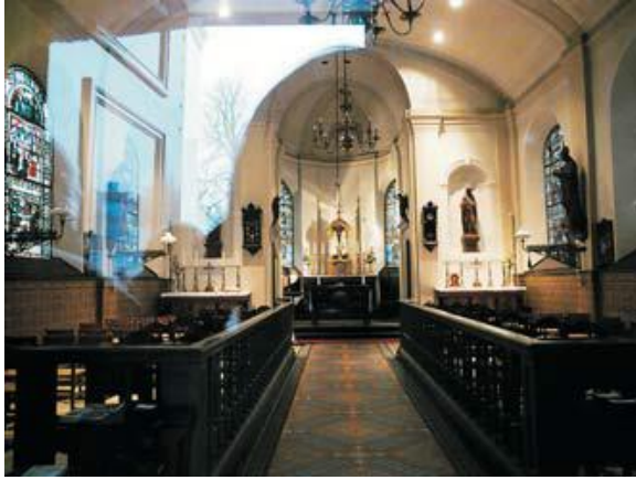
Interieur van de Sint-Catharinakerk

van de twee patroonheiligen. Ook zijn er drie ramen gewijd aan het leven van de Heilige Begga. Het levensideaal van de Het levensideaal van de begijnen was “leven in de voortdurende nabijheid van Christus”.