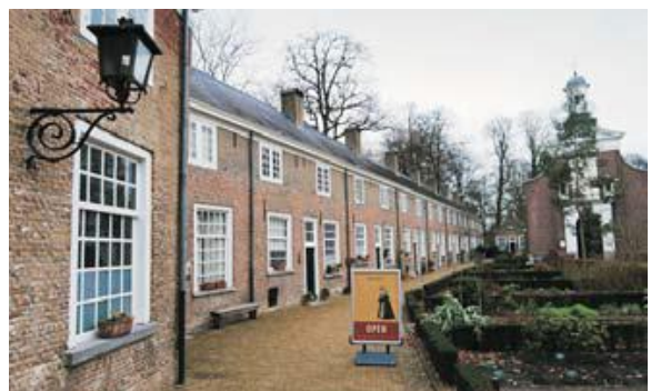
De kruidentuin, met links, in één van de gerestaureerde huizen