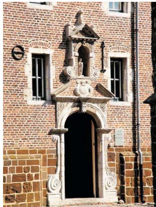
Typisch in het begijnhof van Diest zijn de talrijke barokke deuromlijstingen en heilige nissen, zoals deze van het Apostelenconvent. De vroegere infirmerie en het Apostelenconvent vormen vandaag de dag het cultureel centrum van Diest.

Centraal in het geheel bevindt zich een eenvoudige gotische kerk. Deze is omgeven door een honderdtal huizen, meestal uit de tweede helft van de 17de eeuw, gelegen langs een vijftal straten. In vergelijking met andere stratenbegijnhoven of begijnhoven van het “ministad”-type zijn de straten recht en breed. Typisch in het begijnhof van Diest zijn de talrijke barokke deuromlijstingen en heiligen nissen. De deuren van de individuele huisjes weerspiegelen op die manier als het ware de grote, imposante hoofdboort.