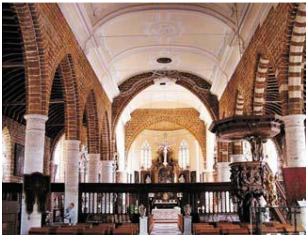
Interieur van de Sint-Catharinakerk van Diest, met achteraan het hoofdaltaar en rechts de imposante preekstoel uit 1671 van Jan Mason.

Tijdens de eerste fase van de restauratie zullen stabiliseringswerken aan de funderingen en restauratiewerken aan de gevels en het dak worden uitgevoerd. Voor de afwerking van de ijzerzandstenen gevels is geopteerd om terug te keren naar gekaleide gevels. Die kaleilaag werd ook in het verleden al aangebracht om de verwerking van de ijzerzandsteen tegen te gaan. Na de restauratie zal de Sint-Catharinakerk, die centraal in het als werelderfgoed erkende begijnhof ligt, weer in al haar glorie kunnen schitteren.