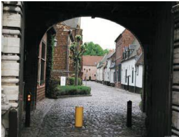
Blik op het begijnhof door de toegangspoort

Zowel de begijnen als de omwonenden voelden zich benadeeld door deze maatregelen en trokken naar de schepbank. Door de aard van de beschuldigingen die werden geuit tegenover de pastoor, kwam ook de inquisitie eraan te pas. In 1548 werd de pastoor echter van alle beschuldigingen vrijgesproken (zie ook het artikel Over den geestelijke levenswandel der begijntjes in Begijnhofkrant 33 , herfst 2011: 2-7 1a ).