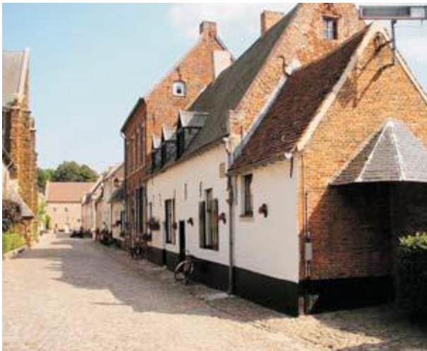
Dit begijnhof rekt men tot het stadstyp, wat betekent dat de huizen langs straten staan en niet rond een centraal plein.

Dit begijnhof rekt men tot het stadstyp, wat betekent dat de huizen langs straten staan, zoals in een “ministad”, en niet rondom een groot centraal plein, zoals onder meer in Turnhout het geval is. Het Diestse begijnhof werd in 1253 gesticht door Arnold IV, heer van Diest, en opgeheven in 1796 door het Franse bewind. De stichting van het begijnhof viel samen met de bouw van de nabijgelegen Onze-Lieve-Vrouwekerk. Het hof bestaat uit vier hoofdstraten en een ruim plein, waarop de kerk staat. De driebeukige Sint-Catharinakerk werd in de 14de eeuw gebouwd in ijzerzandsteen en is een getuige van de Demergotiek. Een bezoek aan dit levendige begijnhof blijft een belevenis, temeer omdat het zich volledig heeft aangepast aan de huidige toeristische normen.