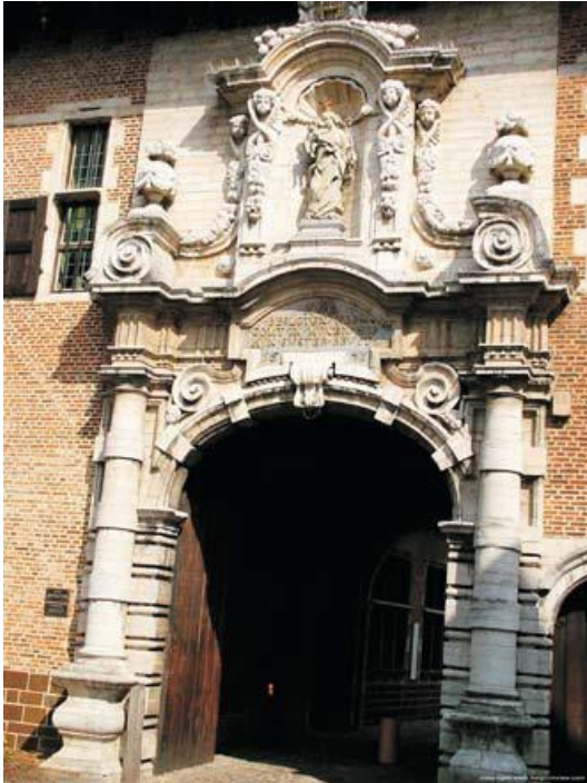
De begijnhofpoort dateert uit 1671 en is een voorbeeld van een barokportaal, waarvan de rijkelijke versieringen bedoeld waren om het geloof van het volk opnieuw te versterken (contrareformatie). Als versiering vinden we onder meer geringde zuilen, voluten, een cartouche onder een gebogen kroonlijst, met een stichtend opschrift.