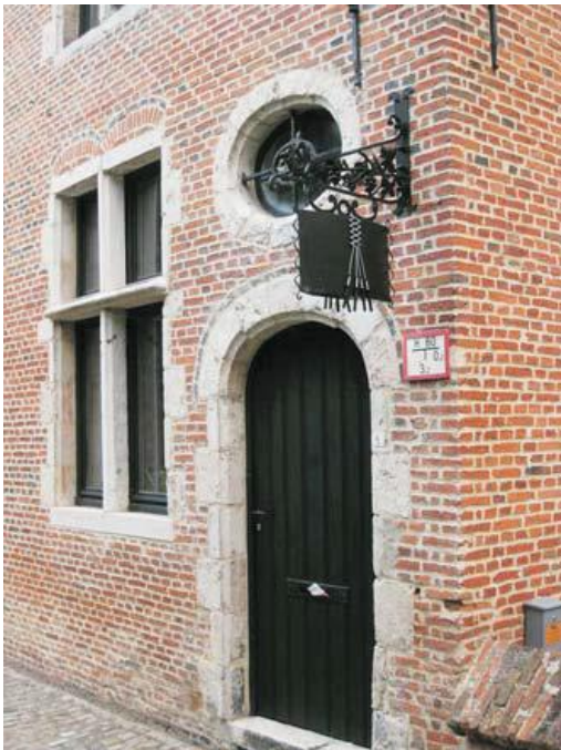
In een van de godshuisjes vindt de kantschool Monica een onderkomen.