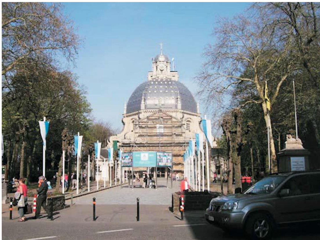
De barokke basiliek van Scherpenheuvel, symbool van de overwinning op de protestanten.