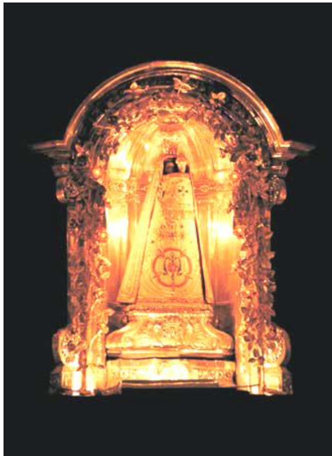
Het mirakelbeeld van O.-L.-Vrouw van Scherpenheuvel, dat nog steeds massaal wordt aanbeden in de basiliek.