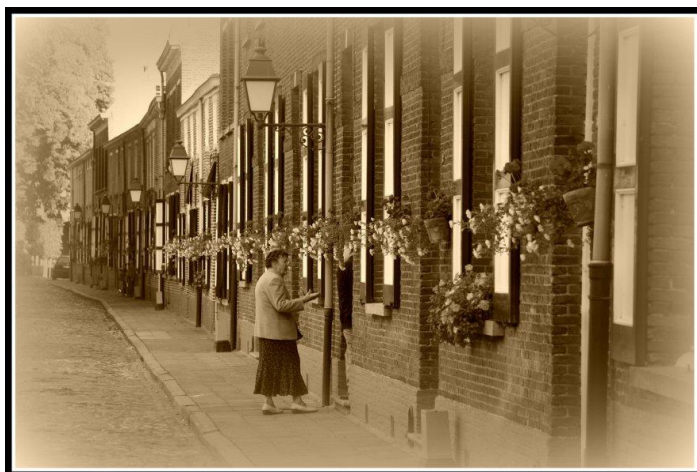
Het begijnhof van Turnhout: het favoriete speelterrein van de jonge Stan Matheussen.

We wisten al heel vlug waar er iets te rapen viel en de huizen waar geregeld wafels en pannenkoeken gebakken werden, waren bekend. “ Belleketrek ” werd daar niet gedaan. De begijnen die niets gaven, konden echter wel wat verwachten. De deurbellen waren immers toch zo verleidelijk: eerst goed uitkijken, dan trekken en... vlug weglopen.