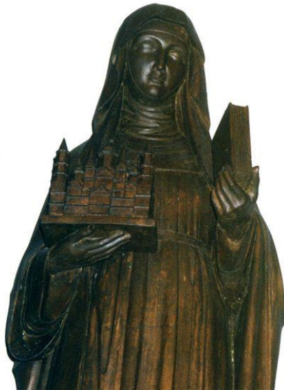
De Heilige Begga, tegen beter weten in gebombardeerd tot patrones van de begijnenbeweging.