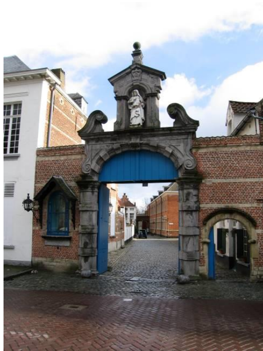
De Heilige Begga in de nis boven de toegangspoort van het begijnhof van Lier.

Vanwaar die mateloze verering in de 17de eeuw voor de H. Begga? Een verering die veel sporen heeft achtergelaten op de begijnhoven. Bijvoorbeeld: welk beeld staat in de nis van de laat 17de-eeuwse begijnhofpoort van Lier? Niet het beeld van de H. Margaretha, patrones van het begijnhof van Lier, maar wel het beeld van de H. Begga. En toch heeft de H. Begga niets – maar dan ook niets – te maken met het begijnenwezen. Men moet geen historicus zijn om dat aan te tonen. (zie ook aanvullende literatuur nr. 2)