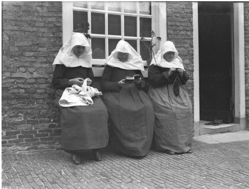
Drie begijnen in het begijnhof van Breda, ca. 1930.

Op 14 april 2013 stierf in Kortrijk de allerlaatste begijn, Marcella Pattyn, op 92-jarige leeftijd. Hiermee kwam er een einde aan een beweging die al tot stand kwam in de middeleeuwen: groepen van religieuze vrouwen die ervoor kozen om samen een leven van religieuze toewijding te leiden, zonder zich daarvoor tot de reguliere orden of kloosters te wenden. De begijnenbeweging wordt dan ook wel gezien als de ‘eerste feministische revolutie’. Het leven in een begijnhof was anders dan het leven in een klooster of dat in andere religieuze instellingen. Begijnhoven waren op zichzelf staande instellingen die geen deel uitmaakten van een overkoepelende organisatie, zoals een kloosterorde, en functioneerden ook grotendeels los van het pauselijke gezag.