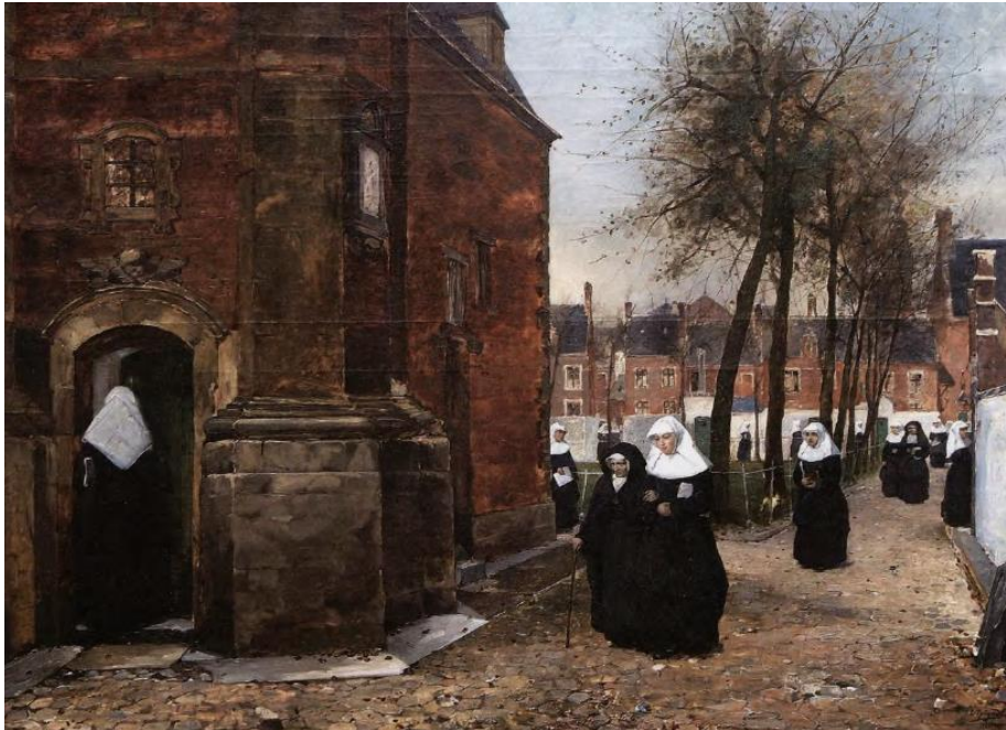
Het klein beghijnhof te Gent van Louis Tytgadt , 1886, olieverf op doek , Musée de l'Art Wallon, Luik

Men moet wat langer kijken naar deze lege en soms weinig verlichte ruimten om er de speciale sfeer en de poëzie van te ontdekken.