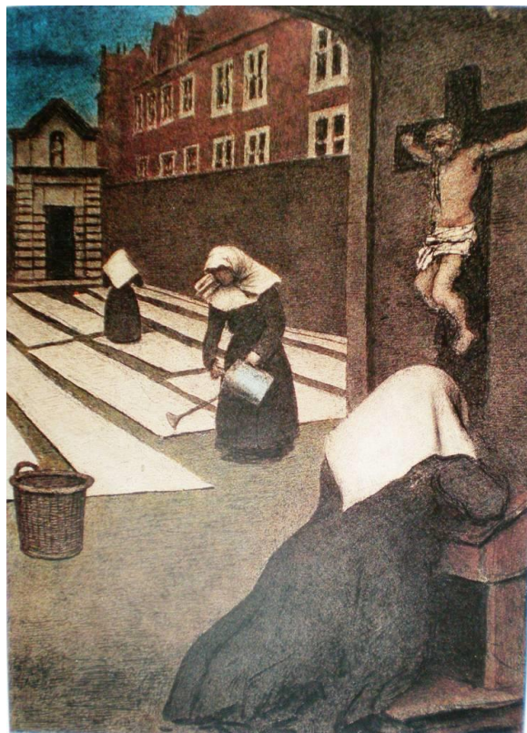
Xavier Mellery: In het begijnhof tijdens het ochtendgebed, ca. 1912, krijt, inkt en aquarel op papier (99,7 x 72,4 cm) [11]

Dit is een mooi voorbeeld uit het intimistische werk dat Mellery onder de titel Emotion d'art: l'âme des choses (de ziel der dingen) exposeerde. In deze intimistische werken, zoals ook in de afbeelding In het begijnhof tijdens het ochtendgebed , verbeeldde hij de fusie van wezens en objecten in een licht dat eenheid geeft aan de compositie, de kleuren verzacht en de al te scherpe contouren verdoezelt. Via het licht, dat getuigt van een contemplatief verlangen zoals dat in het begijnenleven terug te vinden is, voltrekt zich een meditatieve beweging [13].