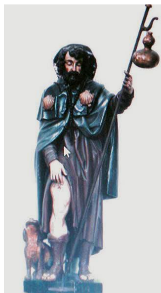
Figuur 5: Gebeeldhouwd en gepolychromeerd Sint-Rochusbeeld uit de eerste Minderbroederskerk van vóór de Franse Revolutie