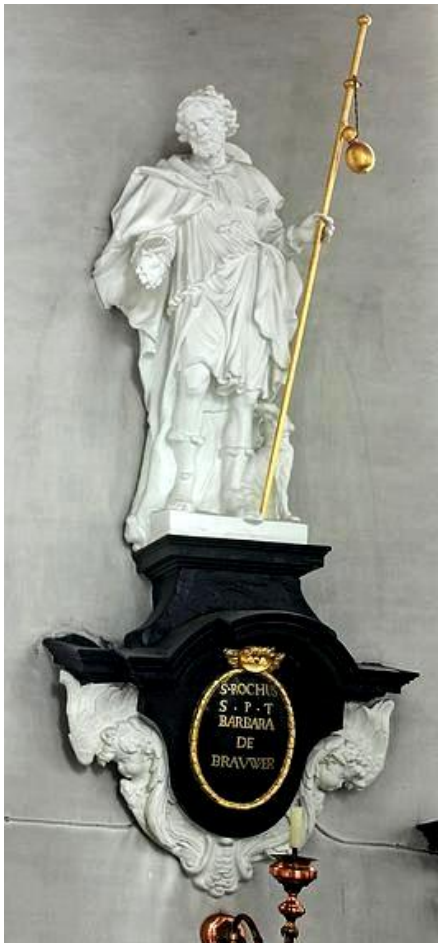
Figuur 1: Beeld van de Heilige Rochus van Montpellier (1651 – 1700) in de Heilige Kruiskerk van het begijnhof te Turnhout. Het houten wit geschilderde beeld staat op een console van steen, met een opschrift van Barbara de Brouwer.

Sinds vele eeuwen wordt Rochus van Montpellier in Europa, Noord- en Zuid-Amerika, het Midden-Oosten, Australië en Azië vereerd door de noodlijdenden tegen cholera, haastige ziekte en onvoorziene dood. Over de hele wereld werden ontelbare parochies, kerken, kapellen, hospitalen, pesthuizen, broederschappen en straten naar hem genoemd en men vindt nog steeds beelden van de heilige in vele straten, kerken en kapellen. Ook in het begijnhof van Turnhout werd gebeden tot de Heilige Rochus om van de pest en andere besmettelijke ziekten bevrijd te worden.