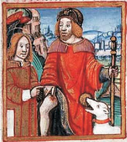
Figuur 6: Middeleeuwse afbeelding van de H. Rochus, vergezeld van de hond die hem voedde en de engel die hem verpleegde en genas.