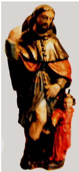
Figuur 4: Sint-Rochus, 17 de eeuw, Taxandriamuseum, Turnhout

Het is mogelijk dat de begijnen onder invloed van de franciscanen of minderbroeders (de bruine paters) deze volksheilige zijn gaan vereren. Vanaf de tweede helft van de 17de eeuw maakten vooral de franciscanen propaganda voor de pestheilige Rochus. Volgens hen behoort Rochus tot de franciscaanse familie, omdat hij lid zou geweest zijn van de Derde Orde van Sint-Franciscus 9 . Vanaf de 15de eeuw kwamen de paters vanuit het minderbroedersklooster in Herentals naar Turnhout om te helpen bij de zielzorg en tijdens de pestepidemieën verzorgden zij de Turnhoutse pestlijders 10 . Zo hebben de paters tussen 1650 en 1656 onder meer tweemaal de pestlijders bijgestaan. Het is dan ook mogelijk dat zij daarom in 1656 bij de wijding van de eerste steen naast Sint-Antonius van Padua ook de Heilige Rochus als patroonheilige van hun kerk in de Potterstraat (nu Patersstraat) hebben gekozen 11 . Zij plaatsten op de hoek van het Paterspleintje een beeld van de Heilige Rochus. Daar staat nu nog steeds een kopie van het Rochusbeeld. Het is alleen spijtig dat het in dezelfde kleur is geschilderd als de muren van het Rochushuis, waardoor het weinig opvalt. Het origineel staat in het Taxandriamuseum (figuur 4).