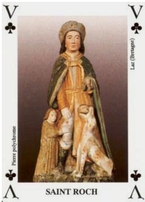
Figuur 2: Heilige Rochus, een kaart uit een souvenirspel (Frankrijk). 22

geneesheiligen: één van de bekendste wonderdokters tegen de pest was Rochus van Montpellier 7 .