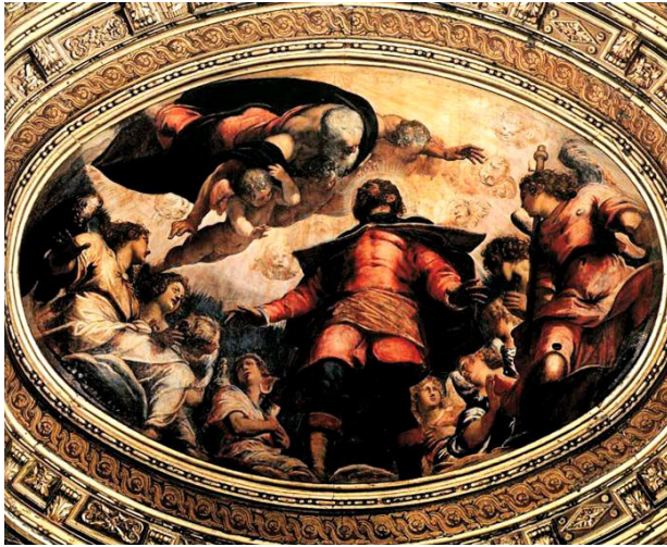
Figuur 7: De verheerlijking van de H. Rochus Tintoretto (1564) Scuola Grande di San Rocco, Salle del'Albergo

mogelijk lag Rocco daar begraven. De relieken -- behalve twee kleine benen uit de arm, die zich in de San Roccokerk in Voghera bevinden -- werden in 1483 naar Venetië overgebracht. De vermeende relieken bevinden zich nog steeds in de prachtige gebouwen van de Scuola Grande di San Rocco, een religieus lekenvereniging, ontstaan na de pestepidemie van 1477 door de samenvoeging van twee aan de Heilige Rochus (San Rocco) gewijde broederschappen. Het scuolagebouw en de aansluitende San Roccokerk zijn vooral bekend omwille van de vele schilderijen op doek van Jacopo Comin, ook bekend als Robusti en il Tintoretto: zie bijvoorbeeld De verheerlijking van de Heilige Rochus (figuur 7).