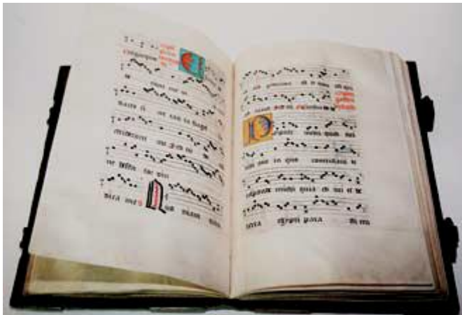
Foto 5: Partituur voor palmzondag (B TUbg Hs01 f23r) Foto 6: Lettrine Heilig Kruis en op Goede vrijdag (TUbg Hs01 f24r)

Foto 5 toont ons met de gezangen “voor palmzondag” en “voor goede vrijdag” hoe de muziek genoteerd werd. We zien zwarte gotische letters en zwarte vierkante noten. De eerste letter is telkens gekleurd en versierd en met rode inkt worden instructies vermeld. Het gebruik van kleuren is essentieel in vrijwel alle liturgische boeken.