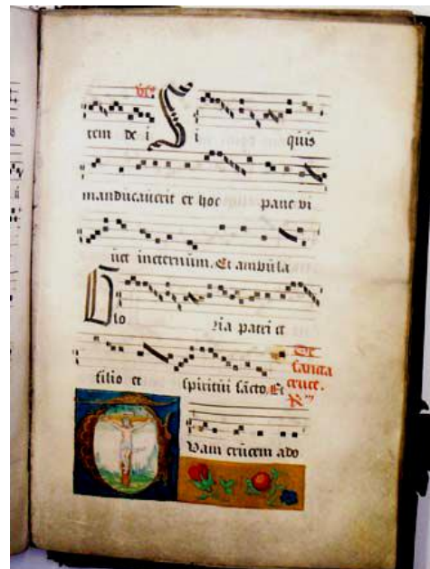
(B TUbg Hs01 f38r)

Gezangen die voor het begijnhof extra belangrijk zijn, krijgen rijkelijk versierde lettrines. Een lettrine is een grote letter, al dan niet versierd, bij het begin van een hoofdstuk of paragraaf. De gezangen voor het feest van het Heilig Kruis zijn opgeluisterd met een miniatuur van de gekruisigde Christus (foto 6). Bij de partituur voor het feest van Corpus Christi zien we een lettrine met monstrans (foto7B) en op het linkerblad wordt het responsorium in rode inkt aangeduid (foto 7A). Bij de versiering van de initialen is gebruikgemaakt van een aantal klassieke types en modellen uit de miniatuurkunst.