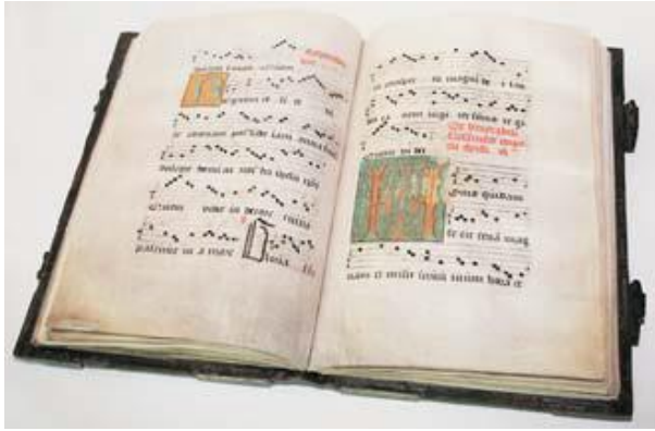
Foto 7A: Partituur voor het feest van Corpus Christi (B TUBg Hs01 f36r)