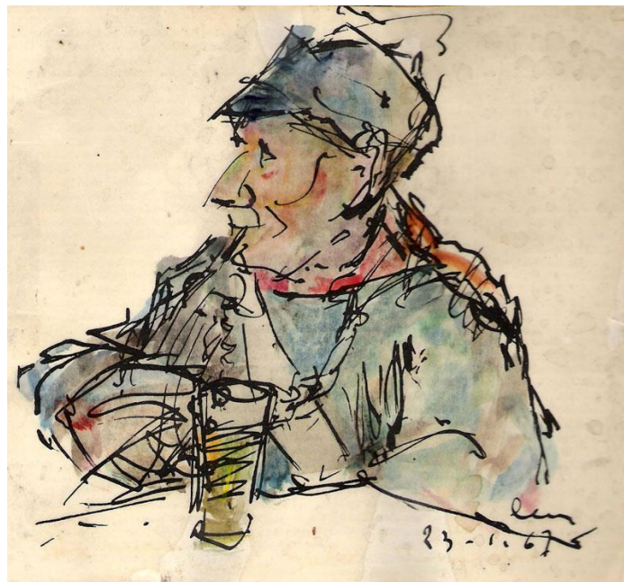
Jan Max, een fraaie aquarel van Remi Lens uit 1967

Vijf jaar later, bij zijn 75ste verjaardag, werden de beste staties van zijn kruisweg tentoongesteld in de kerk van het Heieinde, met als inleiding het in het Latijn gezongen passieverhaal. De gevierde zelf gaf in zijn eigen bekende stijl een boeiende improvisatie bij elk doek. Buiten zijn weten om werd aan zijn vrienden gevraagd een wens of anekdote neer te schrijven en die werden daarna allemaal gebundeld in een fraai boek, Litterae Amicorum .