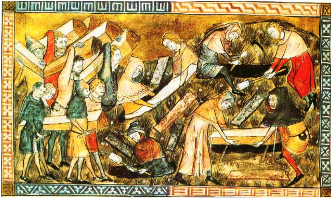
Foto 2: Pestepidemie, miniatuur uit een kroniek van Gillis li Muisit, Annales, 1353, Brussel, Koninklijke Bibliotheek van België)

Het is algemeen bekend dat, na een afwezigheid van zeven eeuwen, de pest vanaf 1347 weer in West-Europa is opgedoken als dodelijke ziekte. De “zwarte dood” (een naam die men pas vanaf de 19de eeuw aan deze ziekte is gaan geven) of de “haestighe siekte”, zoals ze toen werd genoemd, werd in de 14de eeuw waarschijnlijk ingevoerd vanuit het grensgebied van de Himalaya, tussen China en India, waar de pestbacterie (nu bekend als Yersinia pestis ) endemisch, dus sluimerend aanwezig was. Via de Zijderoute bereikte de bacterie in 1346 Kaffa op de Krim, gelegen in het huidige Oekraïne. Met de pestbacterie besmette rattenvlooiën en pestzieke ratten die met de schepen meevoeren, bereikten in 1347 Genua, Venetië en Marseille. De pest verspreidde zich vandaar via de handelsroutes razendsnel door heel Europa en bereikte in 1349 de Lage Landen. De eerste pestepidemie bleef er duren tot 1351.