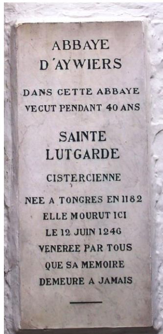
Gedenksteen voor Sint-Lutgart van Tongeren, die 40 jaar verbleef in de abdij van Aywiers, waar ze in 1246 overleed

Ook in deze abdij wensden de zusters haar als overste. Dan bidt ze om nooit Frans te kunnen leren. Haar gebed wordt verhoord, zodat ze zelfs na 40 jaar verblijf in een Waals klooster nog niet in staat is zich in het Frans uit te drukken. Daarom wordt ze vereerd als beschermheilige van het Vlaamse volk.