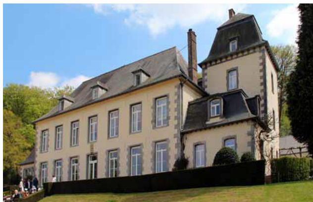
Het voormalige paleis van de voormalige abdij van Aywiers (18de eeuw) in Couture-Saint-Germain, bij Nijvel.