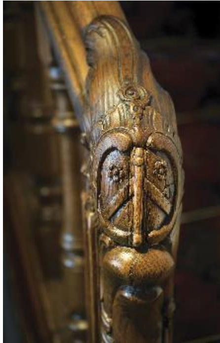
Wapenschild van abdis Eleonore d'Harvengt op de trapleuning van de schuilplaats (refuge) van Nijvel (foto: M. Timacheff).

verwierf de abdij drie huizen in Nijvel, in de rue Saint-Georges. Op de trapleuning van één van die huizen bevindt zich nog steeds het wapenschild van de abdis Eleonore d'Harvengt. De abdij was tevens eigenares van een herenhuis op de Grote Zavel in Brussel, waar later de aardewerkfabriek Boch was ondergebracht en waar thans het NH Hotel Brussels gevestigd is. De rijksarchieven tonen aan dat de zusters van Aywiers er effectief schuilden op het einde van de 17de eeuw.