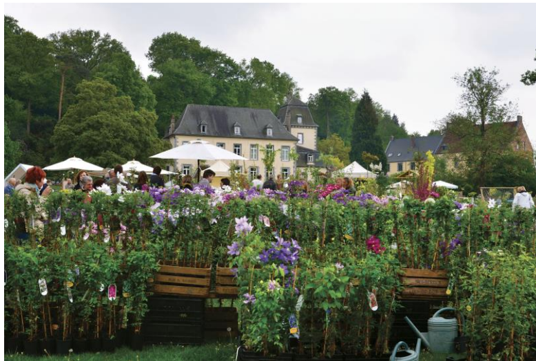
De tuinbeurs 'La Fête des Plantes et du Jardin'.

Couture-Saint-Germain is een deelgemeente van Lasne, gelegen in Waals-Brabant, tussen Waterloo en Waver. Misschien bent u er al geweest ter gelegenheid van de tuinbeurs 'La Fête des Plantes et du Jardin d'Aywiers'? In het eerste weekend van mei en oktober stelt de familie Limaugé haar prachtige domein open voor het publiek en ontvangt zij er gespecialiseerde boom- en plantenkwekers, tuinarchitecten, kunstenaars en ambachtslui uit binnen- en buitenland. Een must voor elke tuinliefhebber die zichzelf respecteert ( www.aywiers.be )!