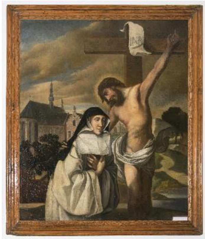
Het Visioen van Sint-Lutgart en Christus aan het Kruis door Abraham van Diepenbeek, ca. 1630, abdij Mariënlof te Kerniel.

België telt vandaag nog veertien abdijen van de Orde der Cisterciënzers: zeven abdijen van monniken en evenveel van monialen. Slechts twee abdijen volgden niet de hervorming van La Trappe of de strikte observantie (1660): de Sint-Bernardusabdij in Bornem (monniken) en de abdij Mariënlof in Borgloon (zusters).