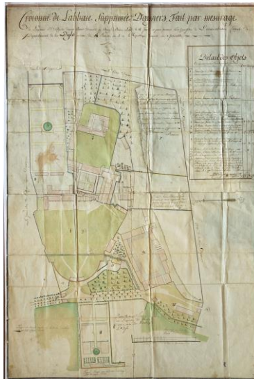
Plan van de 'Afgeschafte abdij van Aywiers' van landmeter P.J. De Rycke van 14 germinal Jaar V (3 april 1797), Algemeen Rijksarchief.