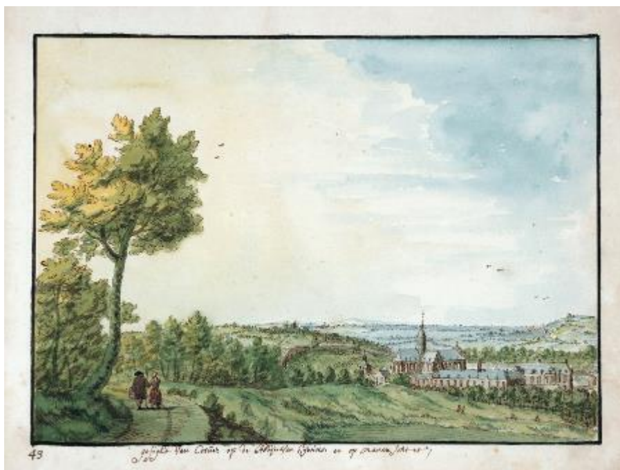
Aquarel van Hendrik van Wel (ca. 1695), Prentenkabinet Brussel.

De gebouwen van de abdij konden worden gereconstrueerd dankzij het plan van P.J. de Rycke. Deze landmeter werd in april 1797 aangesteld door de Franse Republiek om de hele abdij op te meten, met het oog op de openbare verkoop ervan als nationaal goed. Uit dit plan blijkt dat op het einde van de 18de eeuw de abdij van Aywiers een prestigieuze abdij was, bestaande uit een imposante abdijskerk, een kloosterpand met oostelijke vleugel voor de 29 koorzusters en westelijke vleugel voor de 14 lekenzusters, afzonderlijke vertrekken bestemd voor de abdis en een grote infirmerie, die met het klooster verbonden was via een overdekte passage.