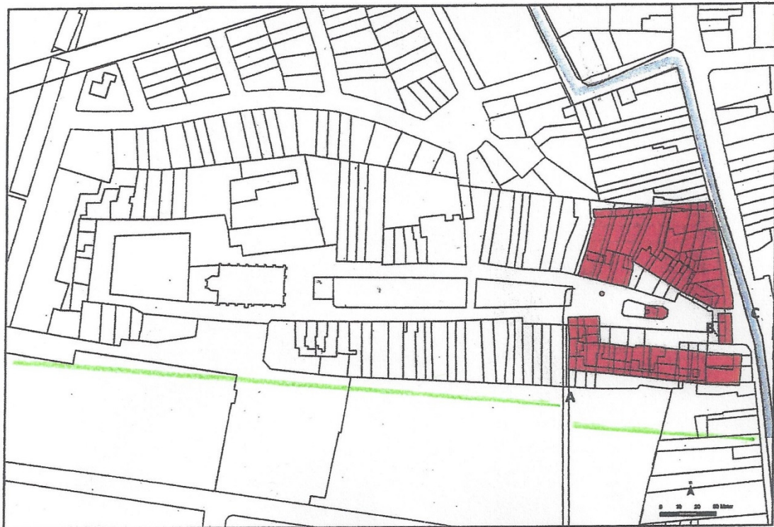
Kaart 1 - reconstructie begijnhof 15e eeuw

Het begijnhof bleef rechtstreeks van het kasteel toegankelijk via de 'boschpoort' (A) al werd een hoofdtoegang in het oosten voorzien. Men moest de Meerloop (C) oversteken om deze toegang te bereiken.